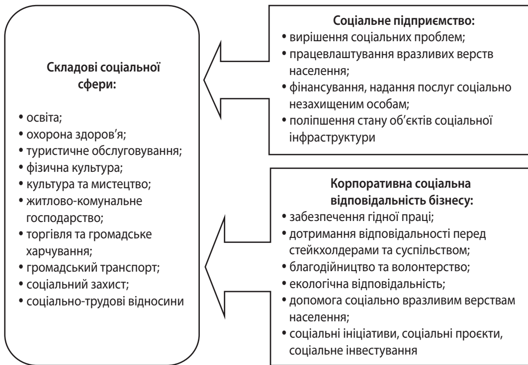
Рис. 2. Діяльність соціального підприємництва та роль корпоративної соціальної відповідальності в контексті соціального розвитку