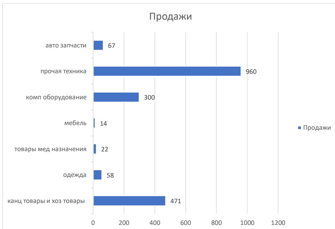
Рис 3. Зарегистрированные договора, посредством аукциона за 1 полугодие 2022 года (млн. сум)

понижении стартовой цены. Тот продавец, кто предложил наименьшую цену, удовлетворяющую характеристикам требуемого товара, побеждает. После заключения договора, товар должен быть доставлен в течении 7 дней до дверей заказчика.