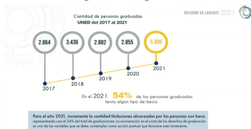
Figura 2. Personas graduadas