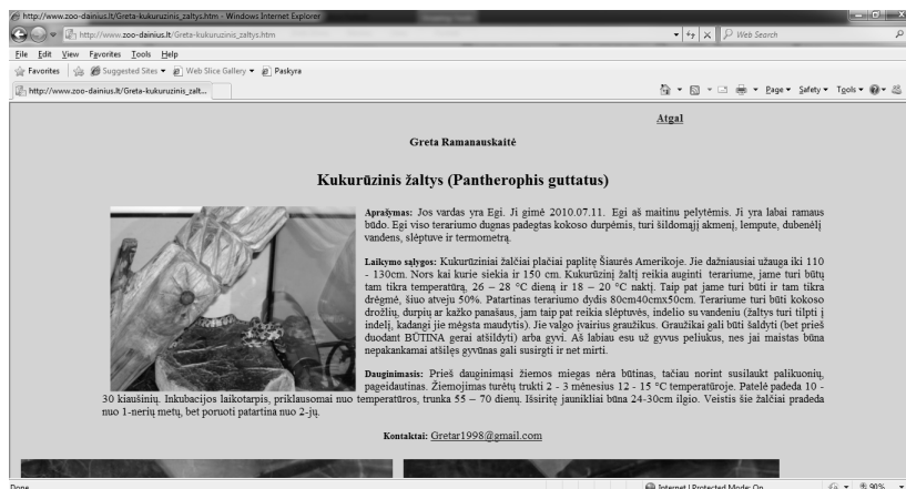
3 pav. Mokinio pateiktas augintinio aprašymas

gyvūnus. Auginamų gyvūnų aprašymas pateikiamas lietuvių ir anglų kalbomis. Taip mokiniai skatinami gilinti lietuvių ir anglų kalbos žinias. Pateikdami augintinių aprašymus