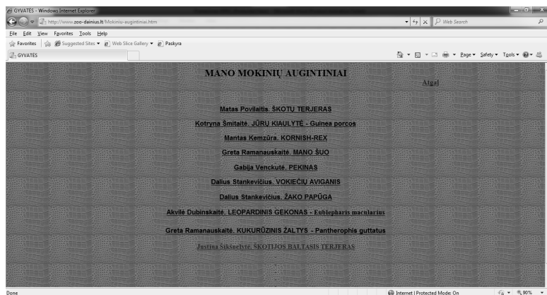
2 pav. Nuorodos „Mokinių augintiniai“ pavyzdys

2010 metų lapkričio mėnesį asmeniniame internetiniame puslapyje įdiegta papildoma nuoroda – „Mano mokinių augintiniai“. Čia mokiniai gali nurodyti savo auginamų gyvūnų duomenis ir pristatyti savo augintinius. Taip pradėtas tęstinis projektas, pristatantis mokinių auginamus