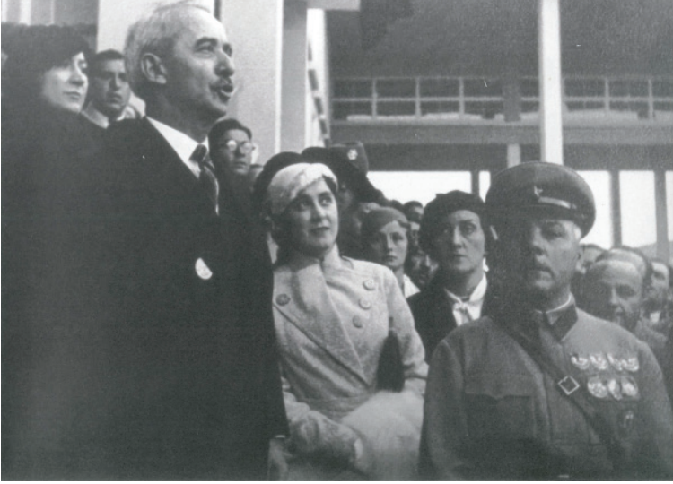
Fotoğraf 4. Başvekil İsmet Paşa Açılış konuşmasını yaparken (1933)

Yüksek Ziraat Enstitüsü'nün açılış töreni basında büyük bir yer bulmuştur. Başta Başvekil İsmet Paşa olmak üzere devlet ileri gelenleri ile yabancı devlet temsilcilerinin katıldığı tören 60 büyük yankı uyandırmıştır. Başvekil İsmet Paşa söylediği nutukla 61 kurdeleyi kesmiş ve orkestranın çaldığı İstiklal Marşı'nın ardından bina gezilmeye başlanmıştır. 62