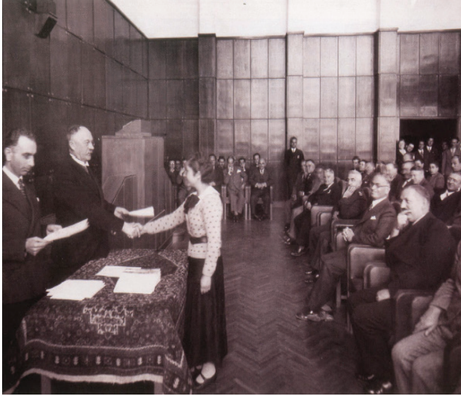
Fotoğraf 5. Öğrenci Yemin Töreninde Rektör Falke Bir Kız Öğrenciye Belgesini Verirken (1937)

Cumhuriyetin Üniversitesi , ed. Atila Cangır, Ankara Üniversitesi Basımevi, Ankara, 2008, s. 203.