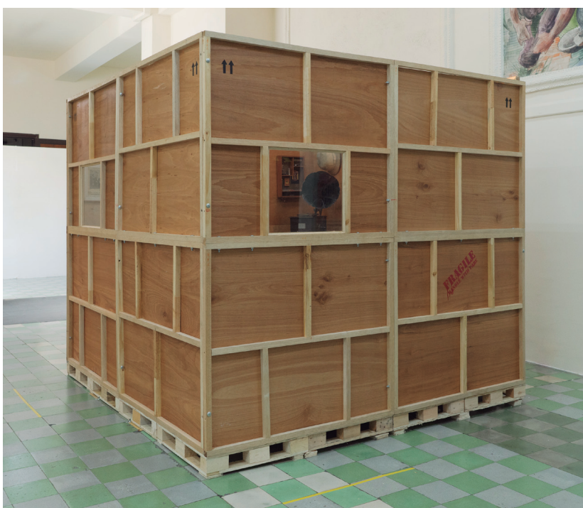
Figura 3, Gestos que contienen, 2020. Fotografía tomada por Felipe García en el Palacio de Bellas Artes, Medellín.