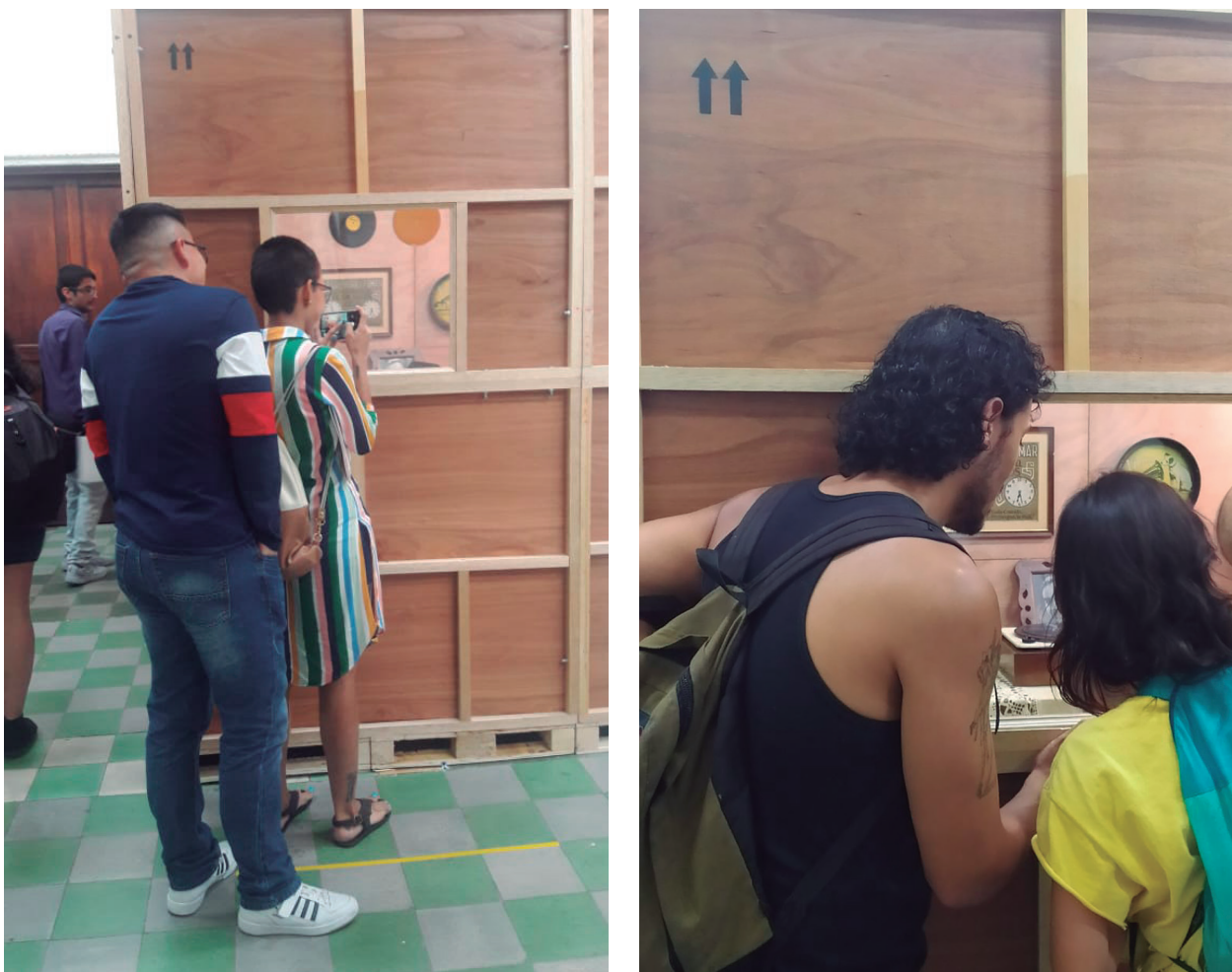
Figuras 5,6. Gestos que contienen, 2020. Exposición de grado Reflexiones cosmopolíticas en el Palacio de Bellas Artes