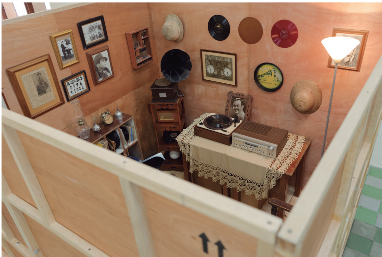
Figura 2. Gestos que contienen, 2020. en el Palacio de Bellas Artes, Medellín.