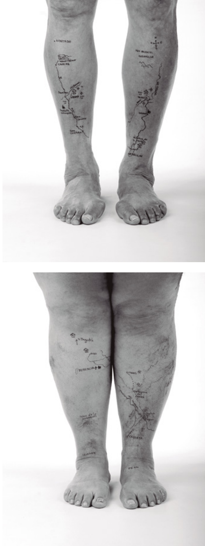
Figura 10. Libia Posada, De la serie Signos cardinales , 2010.

Estas obras de Bravo, Salcedo, Muñoz y Posada ejemplifican las operaciones de la estética forense en el ámbito colombiano: la incorporación de objetos retomados como una manera de producir un vínculo tan-