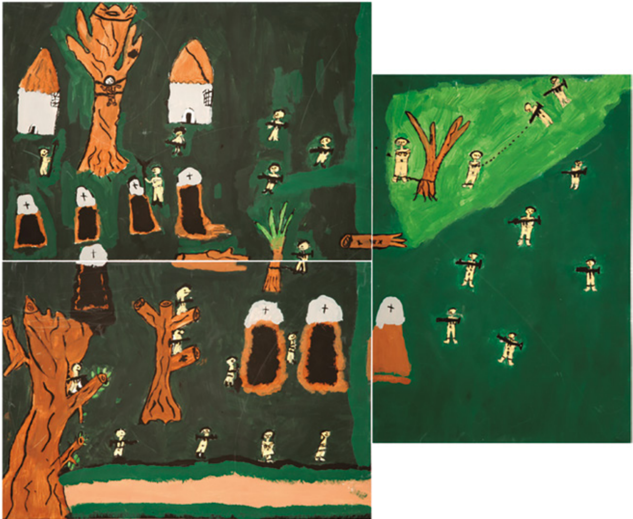
Figura 4. La guerra que no hemos visto. Acrílico sobre papel, 85 x 70 cm.

La agencia de estas pinturas no depende de una supuesta función documental sino de su interpelación afectiva. Estas nos proveen, por lo menos a los espectadores colombianos, poca información nueva sobre el conflicto, poco que no supiéramos ya sobre su violencia y atrocidad. Más bien, las pinturas nos permiten sentir la crueldad de la guerra, la inhumanidad de los crímenes cometidos en medio de ella, los horrores sufridos por las víctimas, así como el sufrimiento y los conflictos internos de los ex-combatientes. Sentimos las tensiones que existen al interior de sus creadores. Las figuras humanas fuera de proporción, el uso inexacto