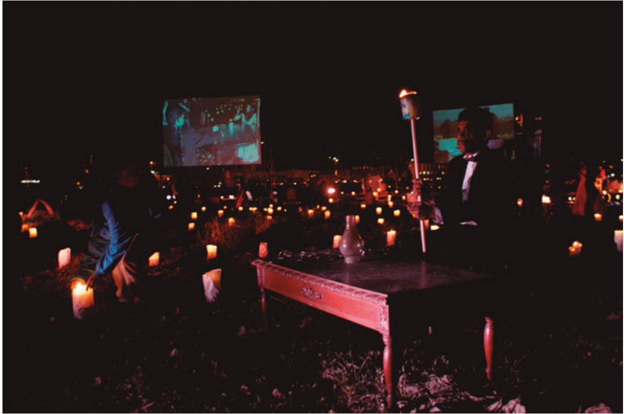
Figura 5. Mapa Teatro, Prometeo II . Bogotá.