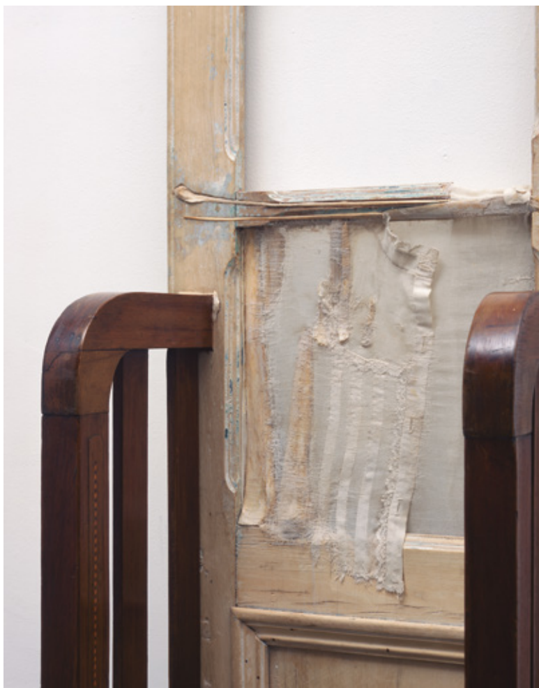
Figura 7. Doris Salcedo, La casa viuda IV (detalle).