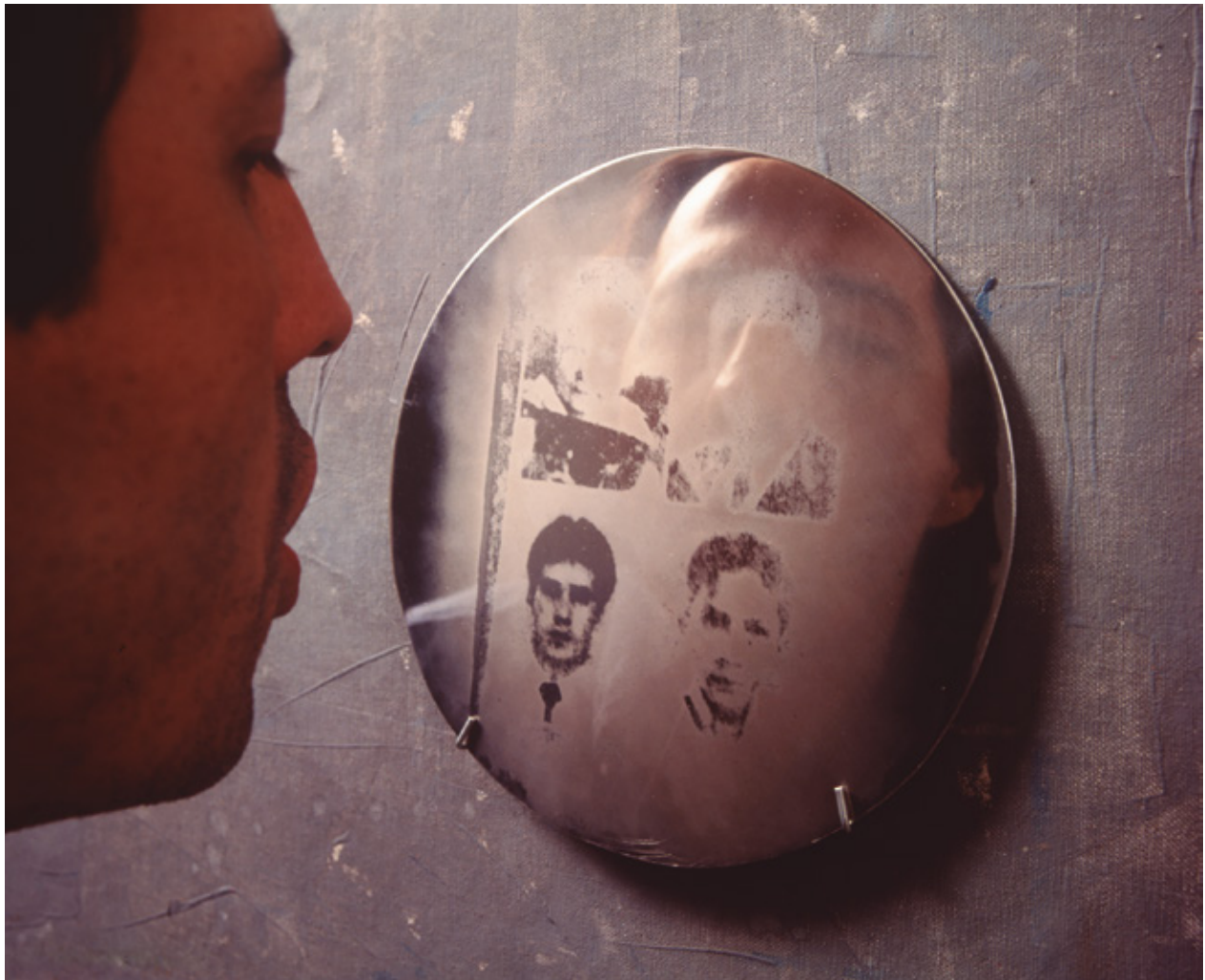
Figura 9. Óscar Muñoz, Aliento .

mento, cuando el espectador, su rostro cercano a los discos, ve aparecer repentinamente las imágenes de los individuos. Aquí también nos encontramos con una doble indexicalidad: hay, claro está, una conexión causal entre las imágenes fotográficas y los individuos en ellas; pero también, el acto de exhalar materializa una conexión igualmente directa entre el espectador y las imágenes, pues la existencia de estas últimas depende de la agencia del primero.