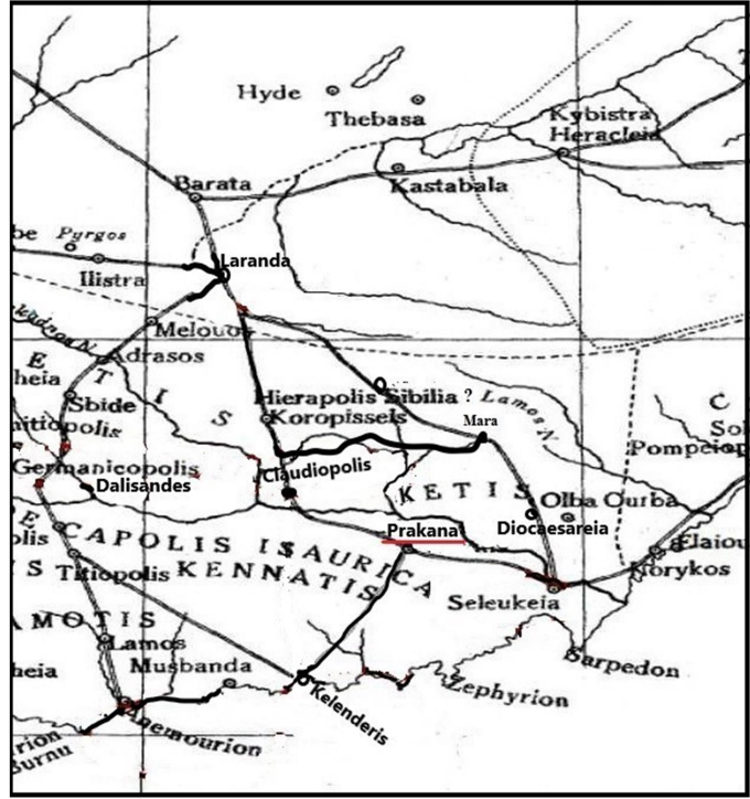
Figür 1: Isauria Eyaleti ve Prakana'nın Konumu (Ramsay 1960, 366)

Prakana ile Diokaisareia'nın aynı yer olduğunu iddia eden bir diğer araştırmacı da B. Umar'dır. Umar'a göre "Sezar (imparatorluk) şehri" anlamına gelen "Diokasaeria'nın adı