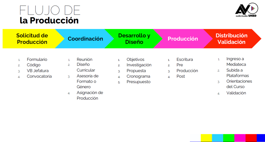
Figura 2. Flujo de las etapas en producción establecidas como protocolo en el PPMA 8