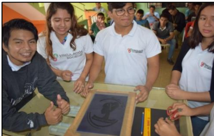
Figura 3. Entrega de material para elaborar el marco o bastidor y la pantalla.

En la figura 2 se muestra el momento de la explicación sobre la Introducción de la Serigrafía y el Estampado como técnica, el cual resultó llamativo para los jóvenes del centro de rehabilitación.