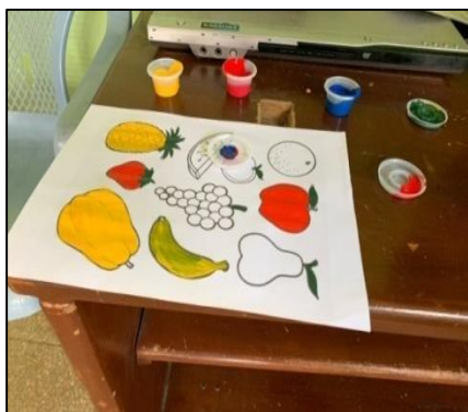
Figura 5. Actividad de mezclas de colores

En la figura 4 se observa al grupo de instructores y jóvenes del Centro de Rehabilitación durante la ejecución de la técnica del estampado en serigrafía, específicamente con la impresión del diseño escogido, en este caso el logo de la clínica.