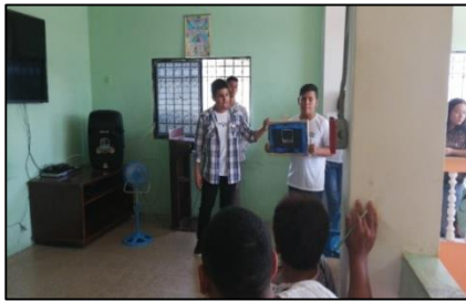
Figura 2. Capacitación de introducción de la serigrafía

En la figura 1 se evidencia al equipo de voluntarios y estudiantes del Instituto de Formación conjuntamente con el Departamento de Vinculación, realizando el levantamiento de información para diagnosticar el problema que presenta el Centro de Rehabilitación El Buen Samaritano.