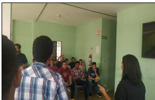
Figura 1. Levantamiento de información