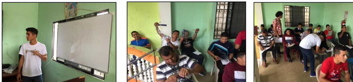
Figura 6. Socialización de los resultados del proyecto

En la figura 6, se observa al grupo de jóvenes del Centro de Rehabilitación El Buen Samaritano compartir la experiencia de lo aprendido durante la Enseñanza de las técnicas de estampado en serigrafía.