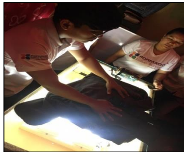
Figura 4. Impresión de franelas, aplicando la técnica de estampado

La figura 3 muestra la secuencia del trabajo del grupo encargado de capacitar a los jóvenes del Centro de Rehabilitación en la elaboración del marco, armado y tensado de la malla, lo que corresponde a la pantalla del marco que servirá para realizar las impresiones. Actividad que requirió de la atención de los presentes.