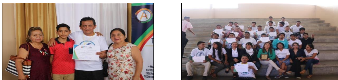
Figura 7. Actividad de clausura y entrega de certificados

En la figura 6, se observa al grupo de jóvenes del Centro de Rehabilitación El Buen Samaritano compartir la experiencia de lo aprendido durante la Enseñanza de las técnicas de estampado en serigrafía.