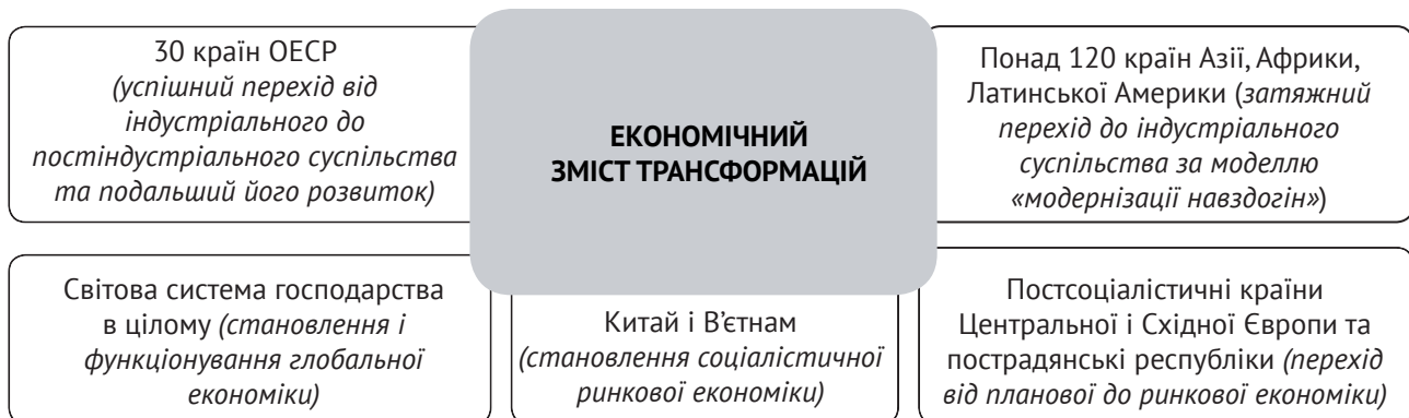
Рисунок 1. Зміст та особливості економічних трансформацій у суспільстві (XXI ст.)

Формування концептуальних засад системних зрушень в економіці за принциповими положеннями узгоджуються з процесом становлення нового типу інституційних і соціально-економічних постулатів у економічних теоріях. Наявні погляди щодо цього питання можна розмежовувати за двома критеріями: 1) за змістом та 2) за особливостями переходу на новий тип економічного розвитку (рис. 1 та рис. 2).