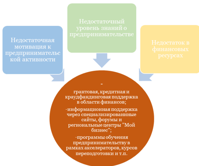
Рис. 2. Структура проблем и способов поддержки молодежного предпринимательства в Российской Федерации

Таким образом, структуру проблем и поддержки молодежного предпринимательства в РФ можно представить на Рисунке 2 .