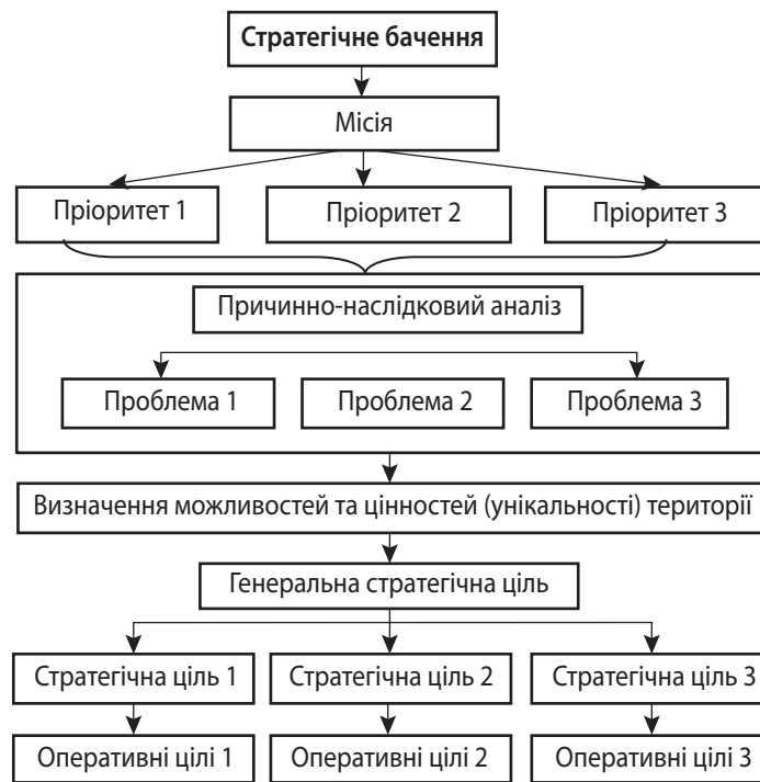
Рис. 1. Дерево цілей стратегічного цілепокладання