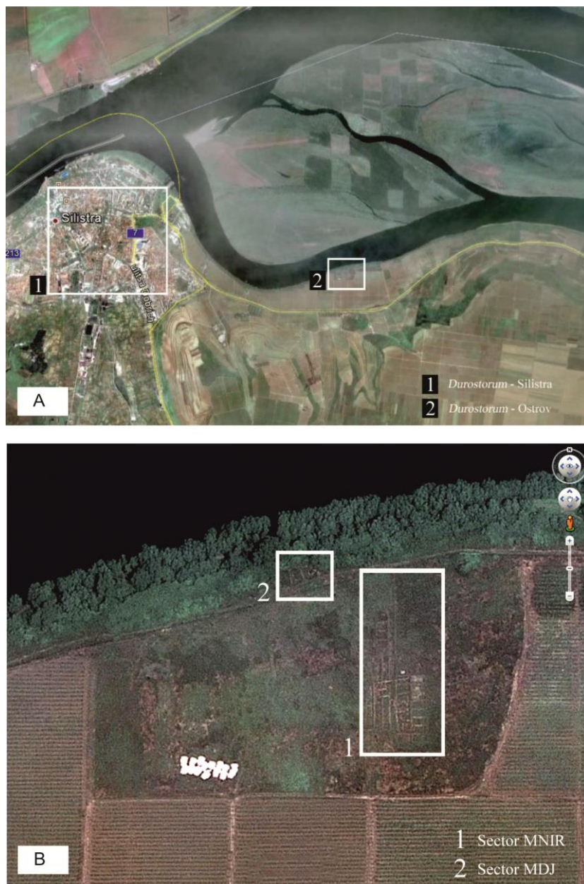
Fig. 1. A. Localizarea siturilor de la Silistra–Durostorum și Ostrov–Durostorum; B. Vedere aeriană asupra cercetărilor arheologice de la Ostrov–Durostorum / A. The location of the archaeological sites of Silistra–Durostorum and Ostrov–Durostorum; B. Aerial view of the archaeological research from Ostrov–Durostorum.