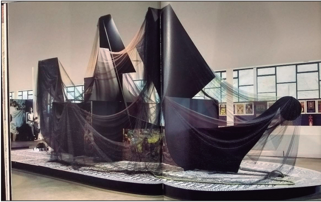
Figura 3 – Instalação Navio Negroiro em 2010

textuais: poemas como o Navio Negroiro de Castro Alves e trechos de citação do trabalho de Fernando Henrique Cardoso, que enfatiza a persistência do racismo no país. O canto supracitado advém de um vídeo que justifica o barulho das águas que se pode ouvir do lado externo; traz imagens do alto-mar, a percepção de seu balanço e outro conjunto iconográfico que faz par às imagens das paredes ao redor: são desenhos e fotografias em preto e branco não datadas, que retratam mulheres e homens negros em uma perspectiva de passividade, representados enquanto trabalham, por diversos ângulos. São retratos que exploram condições de desigualdade e que hoje conhecemos como a iconografia icônica do período escravocrata.