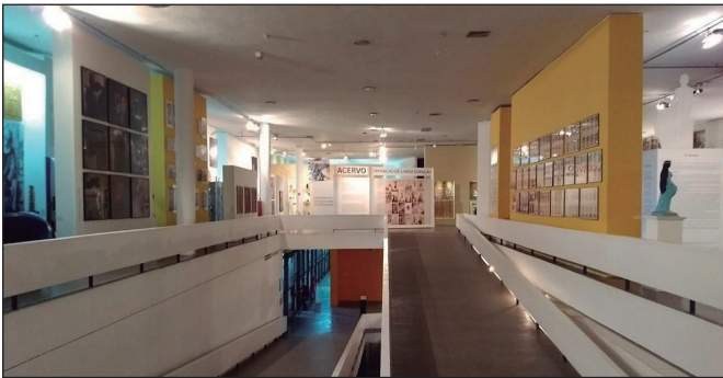
Figura 2 – Vista da exposição do acervo em 2017