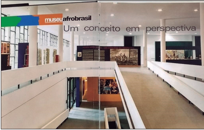
Figura 1 – Vista da exposição do acervo em 2010