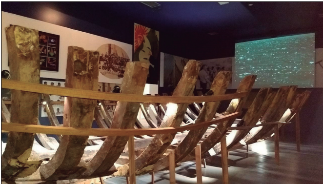
Figura 4 – Instalação Navio Negroiro em 2017