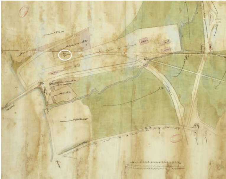
Resim 17. 1902 tarihli Haydarpaşa İstasyonu ve civarını gösteren kroki üzerinde Halid Ağa Çeşmesi'nin taşınmadan evvelki yeri, BOA. PLK. p. 389.