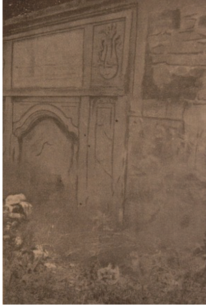
Resim 3. Abdülmecid Han Çeşmesi'nin eski bir fotoğrafı (İbrahim Hilmi Tanışık, İstanbul Çeşmeleri II, Beyoğlu ve Üsküdar Cihetleri, s. 437)