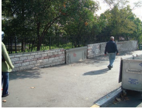
Resim 4. Abdülmecid Han Çeřmesi taç kısmının kazı öncesi cepheden bir görünümü, 2008, (Zeynep Emel Ekim Arřivi)