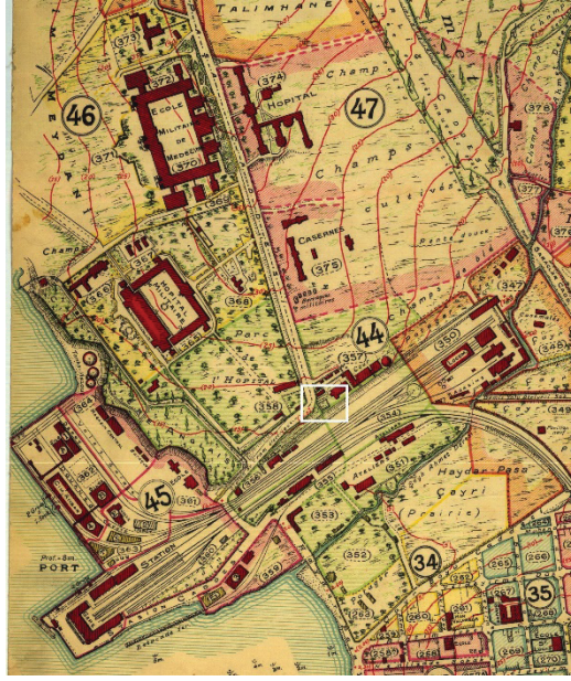
Resim 2. Pervititch Sigorta Haritası'ndaki Abdülmecid Han Çeşmesi'nin taşınmadan sonraki konumu