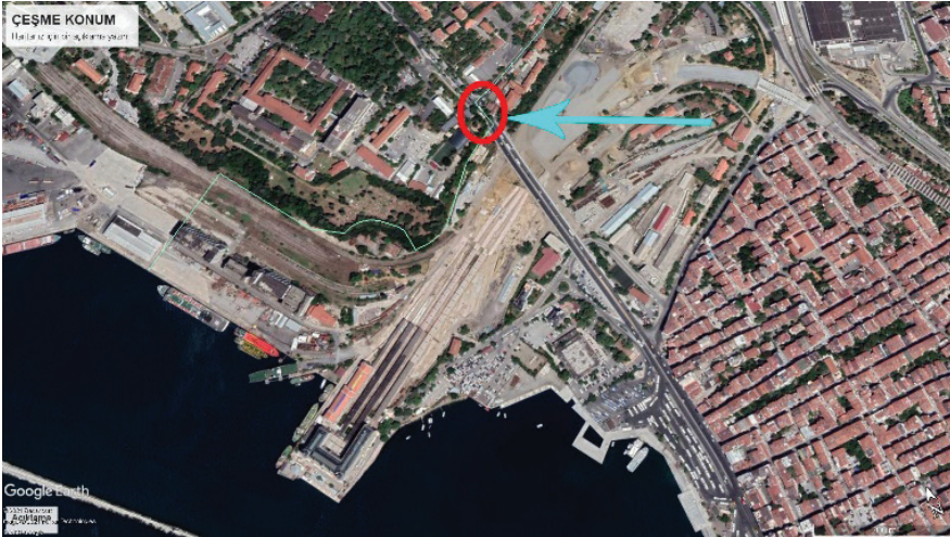
Resim 1. Abdlmeaid Han eřmesi'nin hava fotoėrafından gncel konumu, google earth