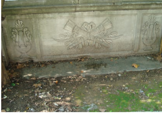
Resim 5. Abdülmecid Han Çeřmesi taç kısmının kazı öncesi sarnıç yönünden bir görünümü, 2008, (Zeynep Emel Ekim Arřivi)