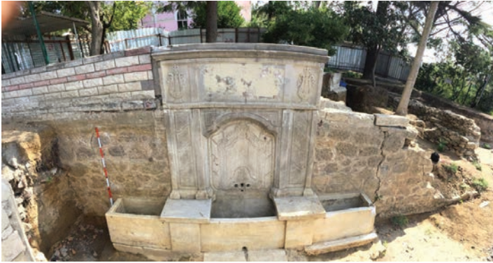
Resim 6. Abdülmecid Han Çeřmesi'nin kazılarla ortaya çıkan cephe görünümü