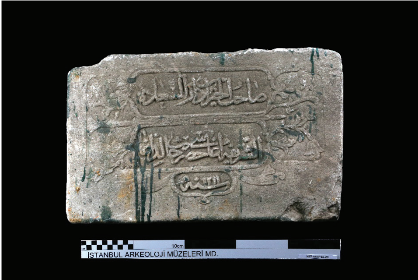
Resim 16. İstanbul Arkeoloji Müzeleri tarafından çıkarılan Halid Ağa Çeşmesi'nin ilk kitâbesi