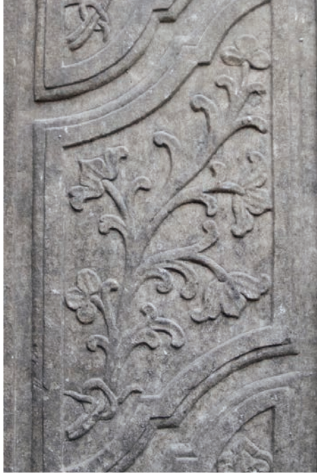
Resim 9. Abdülmecid Han Çeřmesi'nin ön yüzündeki kartuř ii bezeme detayı