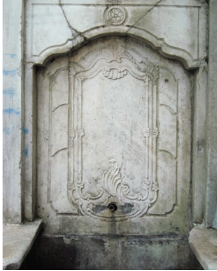
Resim 10. Meryem Kadın Çeřmesi ayna tařı, 2008, (Zeynep Emel Ekim Arřivi)