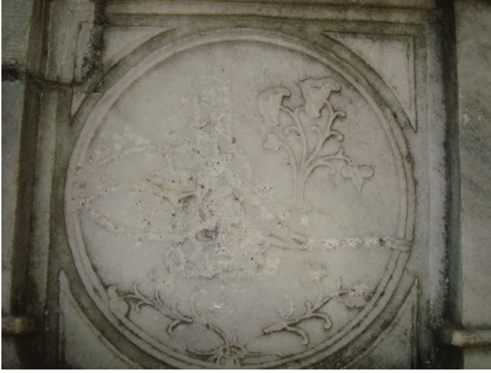
Resim 11. Meryem Kadın Çeşmesi'nin kitâbesi yanlarında yer alan dairesel çerçeve içindeki tuğra ve etrafındaki bitkisel süslemelerden bir detay, 2008, (Zeynep Emel Ekim Arşivi)