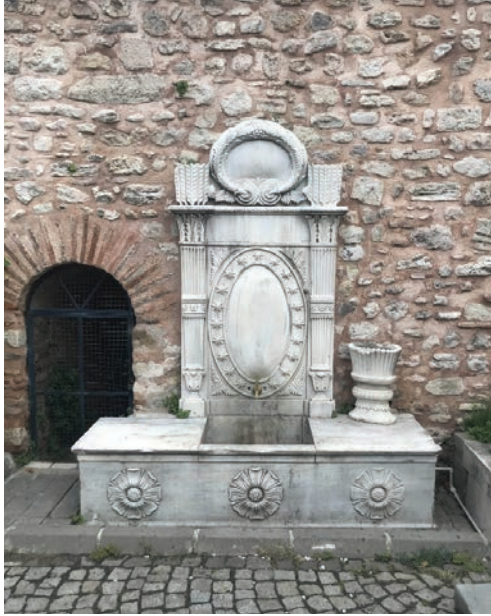
Resim 12. Sultan II. Mahmud Haziresi'nde yer alan bir çeşme, kulturenvanteri.com