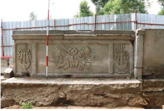
Resim 13. Abdülmecid Han Çeşmesi taç kısmının kazı sonrası, sarnıç yönünden bir görünümü