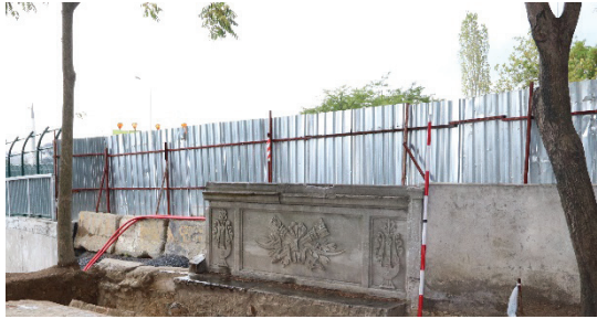
Resim 15. Abdülmecid Han Çeşmesi ve sarnıcının kazı sonrası bir görünümü