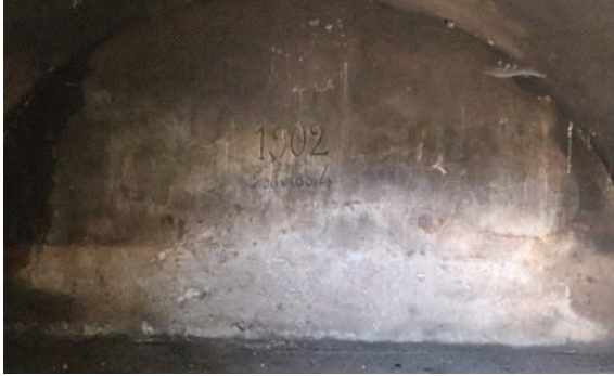
Resim 14. Abdülmecid Han Çeşmesi sarnıcının içten görünümü