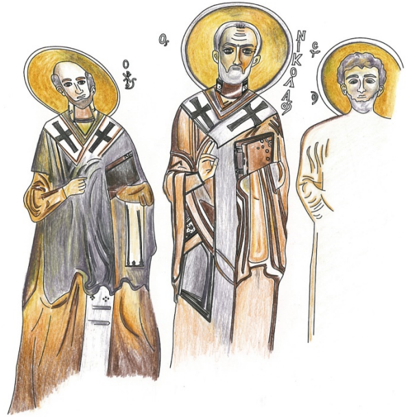
Figür 17: Azizlerin renklendirilmiş çizimi

Figürün benzer örneği Kappadokia'da bulunan Gökçetoprak Kaya Kilisesi'nde 13 ve Ürgüp-Yeşilöz (Tağar) Kilisesi'nde görülmektedir 14 .