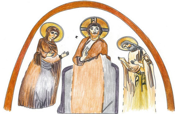
Figür 7: Deesis sahnesi renklendirilmiş çizim

Göğe Yükseliş sahnesinde ise mandorla içinde İsa, etrafında dört melek, İsa'nın hemen alt kısmında Meryem ve etrafında havariler yer almaktadır. Kompozisyon kilisenin tavan kısmının hafif kubbeleştirilmiş bölümünde yer almaktadır ve fon mavimsi gridir. Mandorla içinde oturan İsa melekler tarafından taşınmaktadır. İsa, sol bacağına dayanmış olan sol elinde beyaz bir rulo tutmaktadır. Mürdüm renkli khiton üzerine hardal renginde hymation giymiştir. İsa'nın içinde yer aldığı mandorlayı taşıyan melekler kanatları açık hareket halindeymiş gibi tasvir edilmiştir. Meleklerin kırmızıya yakın halesi ve kanatları vardır. Koyu ve kısa saçlarıyla genç görünüme sahiptirler. İsa'nın hemen alt kısmında yer alan Meryem mavi khiton üzerine kırmızı maphorionlu ve koyu sarı halelidir. Havarilerin birçoğu yıpranmış olsa da Meryem'in sol yanında bulunan iki havarinin ayakları ve hymation larının bir kısmı görülmektedir. Diğer havariler ise güney duvarda görülmektedir fakat üç tanesi belirgindir. Figürler kırmızı haleli olup iki tanesi kırmızı khiton üzerine beyaz hymation giymiştir. Diğerleri ise, beyaz khiton üzerine kırmızı hymation ludur. Figürler ayakta ve şaşkınlık içerisinde farklı duruşlarla tasvir edilmiştir (fig. 8-11).