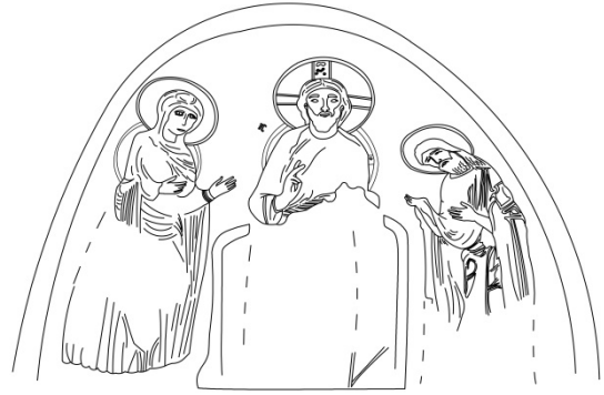
Figür 21: Alt tabaka çizim