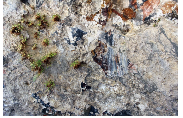
Figür 9: Meryem detay