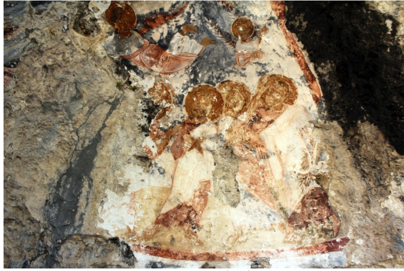
Figür 10: Havariler detay