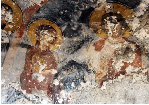
Figür 20: Alt tabaka detay

Geometrik ve bitkisel bezemelerden oluşan süslemenin Kappadokia örneklerine baktığımızda sahneleri birbirinden ayırırken veya figürlerin etrafında görülmektedir. Ağaçalı Kilisesi, Kokar Kilise ve Direkli Kilise'de, kilisemizde bulunan süslemeyi görmek mümkündür 72 . Bu sahne, duvar süslemesinin yanı sıra mozaikte de karşımıza çıkmaktadır. Demre Aziz Nikolaos Kilisesi'nden güneydoğu şapeldeki A panosunda ve orta nef ekseninde bulunan O panosu zemin kaplamasında görülmektedir 73 . Kilikia Bölgesi'nde ise Aloda Kaya Kilisesi tavan süslemesinde karşımıza çıkmaktadır.