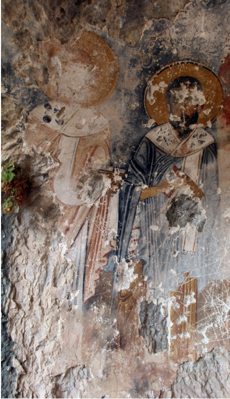
Figür 14: Theologos ve Basileios

önemli rol oynamıştır 4 . 4. yüzyıl ortalarında Kappadokia’da kurduğu manastır sisteminde Basileios, Pakhomios kurallarını benimsese de bazı farklılıklarla onun kurallarından ayrılıyordu. Mısır manastırlarını gereğinden fazla büyük gördüğünden küçültmeye başlamıştır. Manastırların çöllerde değil kentlerde kurulmasını istemiş ve böylelikle insanlardan uzak yaşamayarak, hem onlara yardımcı olabilecek hem de Hıristiyan yaşamı hakkında örnek teşkil edilecekti. Basileios, çilekeşlik ve nefsin köreltilmesinde aşırılığı yasaklamış olup, özel olarak oruç tutmak isteyenlerin ise baş keşişten izin alması kurallarını koymuştur. Yazılmış olan bu kurullarla, Mısır keşişlerinin bağınazlığı ve Suriyeli sitilitlerden farklı olarak ilimlilik ve pratikliği ortaya koymuştur 5 . Bu kurullar gerek Bizans’ta gerekse imparatorluğun dışında manastır sisteminin gelişmesinde büyük rol oynamıştır 6 .