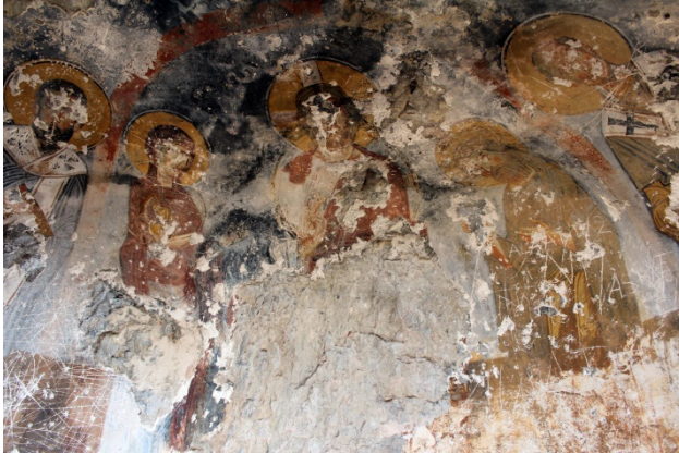
Figür 6: Deesis sahnesi

Apsis kısmında bulunan Deesis sahnesinde; ortada İsa, sağında Meryem ve solunda Vaftizci Yahya ayakta durur şekilde tasvir edilmiştir. İsa merkezde, tahtta oturur şekilde, diğer figürlerden daha büyük tasvir edilmiş ve sağ eliyle takdis etmektedir. Ayrıca İsa'nın sağ tarafında "IC" yazısı görülmektedir ancak sol tarafında olması gereken "XC" ise günümüze ulaşmamıştır. İsa, uzun kıvılc saçlı ve sakallıdır. Üzerine kırmızı hymation giymiştir. Koyu sarı halesi içinde bezemeli haç motifi bulunmaktadır. Meryem, İsa'nın sağında dörtte üç profilden, dua eder şekilde tasvir edilmiştir. Koyu mavi khiton üzerine kırmızı maphorion giymiş ve sarı halelidir. Vaftizci Yahya da Meryem'in karşısında ve İsa'ya doğru dua eder şekilde tasvir edilmiştir. Sarı khiton üzerine kahverengi hymation giymiştir. Sarı haleli figür uzun saçlı ve sakallıdır. Sahne kırmızı şeritle çevrelenmiştir ve fon koyu mavidir (fig. 6-7).