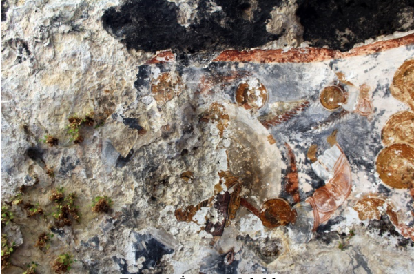
Figür 8: İsa ve Melekler