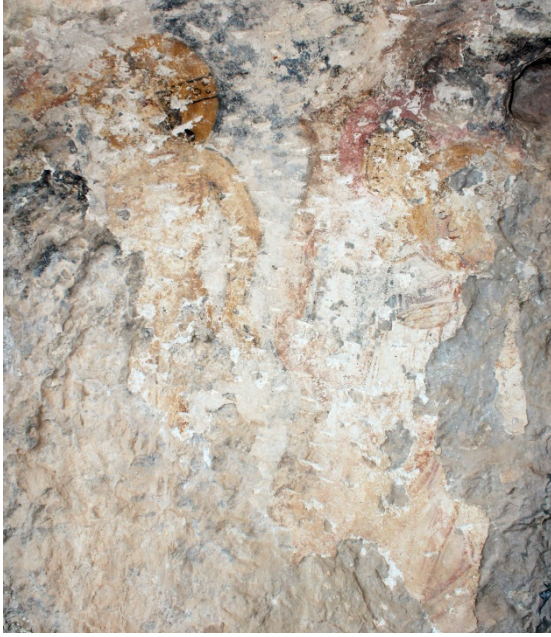
Figür 12: Vaftiz sahnesi

Vaftiz sahnesinde ise, İsa kompozisyonun ortasında tasvir edilmiştir. Solda Vaftizci Yahya'nın sadece eli görünmekte sağda ise arka arkaya iki melek tasvir edilmiştir. Sahnede fon mavimsi gridir. İsa dörtte üç profilden ayakta ve çıplak olarak görülmektedir. Uzun saçlı, sakallı genç bir erkek olarak tasvir edilmiştir. Koyu sarı halesi içerisinde bezemeli haçın bir kolu görülmektedir. Vaftizci Yahya, İsa'nın sağında ve eli İsa'nın başında onu vaftiz ederken betimlenmiştir. Elin uzanması dışında figür tahrip olmuştur. Sahnenin sağında art arda duran melekler dörtte üç profilden tasvir edilmiştir. Beyaz khiton üzerine kırmızı hymation giymişlerdir. Öndeki figürün ellerinin üzerinde İsa'ya doğru uzattığı bir havlu bulunmaktadır. Melekler koyu renk saçlarıyla genç bir şekilde tasvir edilmiştir (fig. 12-13).