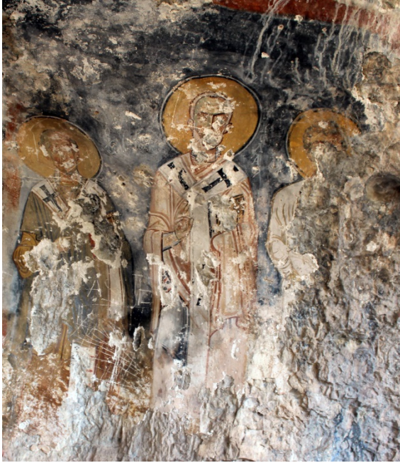
Figür 16: Khrystostomos, Nikolaos ve Stefanos

26 Şubat 398-20 Haziran 404 tarihlerinde İstanbul piskoposu olan Aziz Khrystostomos, 340-350'de doğmuş, 14 Eylül 407'de Komana'da (Gümenek) ölmüştür. Zengin bir ailenin çocuğu olan aziz Libanios ve Tarsus'lu Diododros'tan iyi bir eğitim almıştır. Rahip olduktan kısa bir zaman sonra çölde inzivaya çekilmiştir. Antakya'ya döndükten sonra 381 yılında diakon, 386 yılında da rahipliğe atanmıştır. Daha sonra İstanbul'a davet edilip, Nektarios'un yerine piskopos olmuştur 10 . Aziz Khrystostomos ahlak, münzevi hayat ve bakirelik, münzevilerin birlikte yaşaması ve rahip evleri üzerine yazılar yazmıştır. Sirk, tiyatro ve diğer halk eğlenceleri, araba yarışları üzerine değerlendirmeleri vardır. Bir başka eseri de Çocukların Eğitimi'dir. Ataerkil çekirdek aileyi savunmuştur. Sosyal adalet duygusu güçlü bir azizdir. 21 homilyesi olan azizin ilk biyografisi Helenopolisli Palladios tarafından 425 yılında yazılmıştır. Biyografinin içeriği, Roma'da anonim bir doğu piskoposu ile diakon Theodore arasında geçen hayali bir diyalogdur 11 . Khrystostomos homilyesinin resimlerinde, yazar olarak incilci şeklinde betimlenmiştir. Bazı zamanlarda omzunun üst kısmında Paulus veya Lukas ona ilham veriyor gibi tasvir edilmişlerdir. Karakteristik özellikleri içe çökmüş yanakları ve arkaya doğru uzanan başıdır 12 .