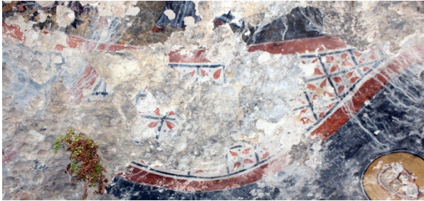
Figür 18: Bitkisel ve geometrik bezeklerden oluşan süsleme

Tavan kısmının doğu bölümündeki bitkisel ve geometrik bezemelerden oluşan desen, etrafı kalın bir şekilde kırmızı kontur çizgisi, onun da etrafı ince, mavi renkli bir şerit ile çevrelenmiş, içi mavi renkle karelere bölünerek, yaprakları kırmızı orta kısmı sarı renkten oluşan çiçek formu verilmiş bir süslemeden oluşmaktadır (fig. 18-19).