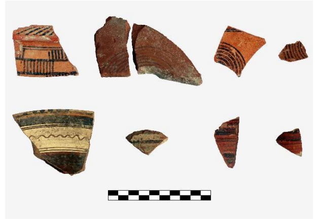
Figür 13: Lydia seramikleri