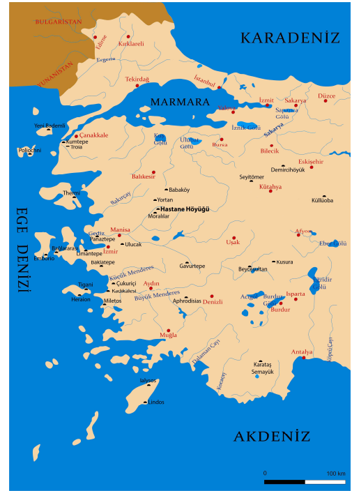
Figür 1: Hastane Höyüğü'nün konumu

E. Akdeniz başkanlığında gerçekleştirilen kazı çalışmaları Tepe Mezarlığı ve Hastane Höyüğü alanlarında devam etmektedir. Son yıllarda araştırmalar Hastane Höyüğü alanında yoğunlaşmış durumdadır (fig. 2-3). Hastane Höyüğü'nü, Thyateira antik kentinin "erken dönem yerleşimi" olarak tanımlamamız yanlış olmayacaktır. Söz konusu alanda gerçekleştirilen kazı çalışmaları sırasında bulunan seramik parçaları, höyükteki iskanın Geç Neolitik Çağ'a kadar uzandığını kanıtlamaktadır 4 . Bölgenin erken dönem yerleşimi konusunda önemli bilgilere ulaşılan alan neredeyse günümüze kadar iskan görmeye devam etmiştir. Hastane Höyüğü'nün aynı zamanda Thyateira antik kentinin akropol tepesi olma olasılığı da son derece yüksektir.