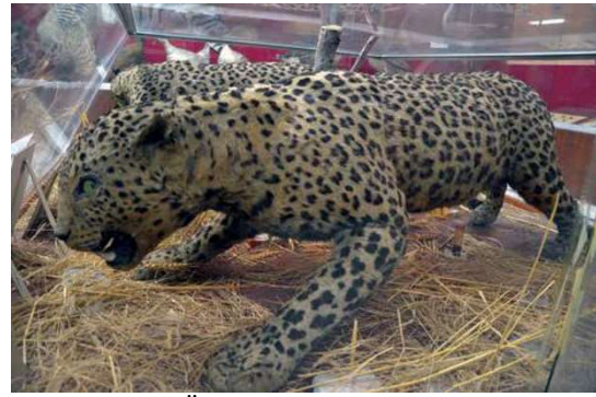
Figür 8: Ege Üniversitesi, Tabiat Tarihi Müzesi'nde sergilenen Anadolu Parsı