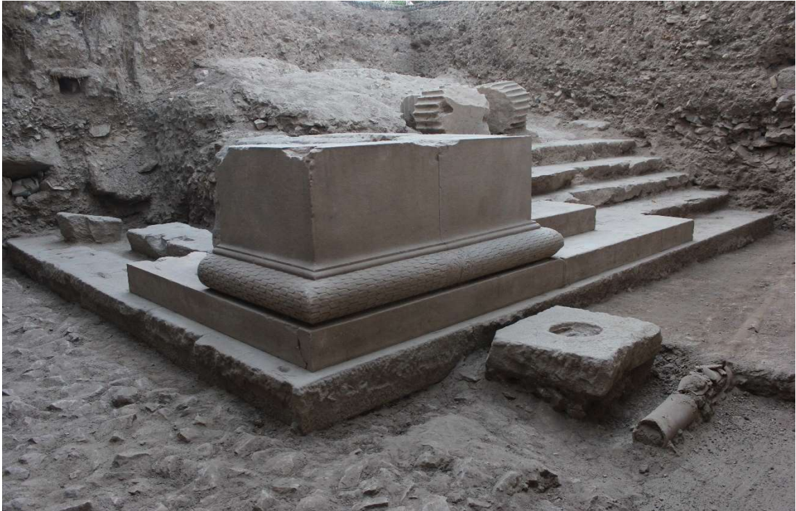
Figür 4: Tapınağın güneydoğu köşesi

Çalışma konusu olan Anadolu parsı heykel parçası 5 , 2015 yılında Hastane Höyüğü alanında gerçekleştirilen kazı çalışmaları sırasında ortaya çıkarılmıştır. Eserin özelliklerine değinmeden önce, buluntu yeri hakkında bilgi vermek yararlı olacaktır. Akhisar ilçe merkezi sınırları içerisindeki en önemli yükselti olarak tanımlayabileceğimiz Hastane Höyüğü alanındaki çalışmaların planlanmasında, 2013 yılı kazıları oldukça belirleyici olmuştur. Söz konusu yılda höyüğün zirve noktasında gerçekleştirilen kazı çalışmaları sırasında, anıtsal nitelikte bir yapının kalıntıları ortaya çıkarılmaya başlanmıştır. İlk kalıntılardan yola çıkılarak yapının bir sunak olabileceği düşünülmüştür 6 . Kazılar ilerledikçe kalıntıların bir sunak yapısından ziyade bir tapınak yapısına da ait olabileceği düşüncesiyle yapı "sunak/tapınak" olarak adlandırılmaya başlanmıştır 7 . Fakat son çalışmalar ışığında yapının bir tapınak olduğu sonucuna ulaşılmıştır 8 (fig. 4-6).