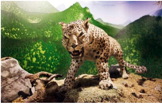
Figür 7: Maden Tetkik Arama (MTA) Tabiat Tarihi Müzesi'nde sergilenen Anadolu Parsı

20. yüzyıla kadar Anadolu parsı yaşadığımız coğrafyada görülmeye devam eder. İnsanoğlunun yaşamın sadece kendisi için var olduğu düşüncesi, kimliğinin hastalıklı yanlarından bir tanesi olmalıdır. Yaşadığı coğrafyayı sahiplenip kendisi için tehdit oluşturduğunu düşündüğü canlıları ortadan kaldırma çabası bu durumun bir sonucu olabilir. İnsanın bu vahşi yanından Anadolu parsı da nasibini almıştır. Halk tarafından "canavar" ve "benekli" gibi isimlerle anılan Anadolu parsı, bir tehdit olarak algılanmıştır. Anadolu parsı da bu "vahşi" sıfatı nedeniyle nesli tükenmiş belki de nesli tükenmekte olan bir canlı türüdür. 1920'li yılların sonlarından itibaren avcıların Anadolu parsını avlamaya çalıştıkları bilinmektedir. "Mantolu Hasan" olarak nam salmış bir avcının 1930-1950 yılları arasında çok sayıda Anadolu parsını vurduğu kayıtlara geçmiştir 16 . Anadolu'da gerçek anlamda yaşadığı bilinen son Anadolu parsı 1974 yılında Ankara ili, Beypazarı ilçesi, Bağözü köyü yakınlarında vurulmuştur 17 . Son on yıl içerisinde özellikle Güneydoğu Anadolu Bölgesi'nde leoparların yaşadığına ya da daha doğru bir ifadeyle "yaşamaya çalıştığına" dair kanıtlar bulunmaktadır 18 . Araştırmacıların önemli bir bölümü Güneydoğu Anadolu Bölgesi'ndeki örneklerin Anadolu parsından ziyade İran parsı olabileceklerini iddia etmektedir. Fakat Anadolu parsı olduklarını savunanlar da yok değildir.