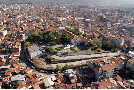
Figür 2: Hastane Höyüğü'nün hava fotoğrafı, batıdan görünüm