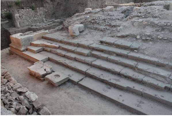
Figür 5: Tapınağın doğu yönündeki girişi