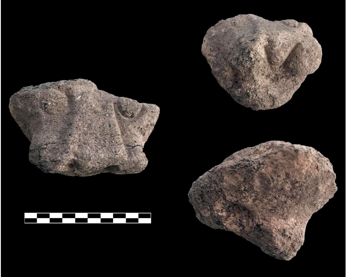
Figür 9: Anadolu Parsı heykel parçasının farklı açılardan fotoğrafları

Anadolu parsı heykel parçasının tuf taşı malzemeden yapılmış olması oldukça önemlidir. Volkanik tuf taşı 27 işlenmesi kolay bir malzemedir. Fakat mermer kadar dayanıklı değildir. Batı Anadolu'da MÖ 8.-6. yüzyıllar arasında volkanik tuf taşının tercih edilen bir malzeme olduğu bilinmektedir 28 . Söz konusu dönemin önemli yerleşimleri arasında yer alan Smyrna 29 , Phokaia 30 , Larisa 31 ve Antandros'ta 32 tuf taşından yapılmış buluntu ve kalıntıların varlığı bilinmektedir. Ayrıca Myrina ve Gryneion yüzey araştırmaları sırasında tespit edilen tuf taşından yapılmış bir Aiol kymationu bezemeli mimari parça da anılmaya değerdir 33 . Volkanik tuf taşı kullanımının özellikle MÖ 7.-6. yüzyıl arasında artış gösterdiği bilinmektedir. Bu bilgi Hastane Höyüğü buluntusu Anadolu parsı heykel parçasının döneminin tespiti çalışmaları açısından oldukça önemlidir.