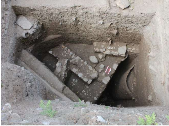
Figür 12: İ-36/d plankaresi

Bu durumda akla Anadolu parısı heykel parçasının hangi yapıya ait olduğu sorusu gelmektedir. Anadolu parısı örnekleri genel olarak değerlendirildiğinde, eserlerin önemli bir bölümü tapınım ile bağlantılı alanlarda bulunmuştur. Tapınım alanları incelendiğinde kült alanlarının zorunluluk olmadıkça yer değiştirmedikleri anlaşılmaktadır. Hastane Höyüğü alanı üzerinde Geç Hellenistik Dönem'e tarihlendirilen bir tapınağın varlığı bilinmektedir 64 . Çalışma konusu olan eser de söz konusu alanda, tapınağın üzerinde, geç dönem kullanımları ile bağlantılı seviye içerisinde bulunmuştur. Anadolu parısı heykel parçasının Geç Hellenistik Dönem tapınağının altında veya yakın çevresinde yer alan, olasılıkla MÖ 6. yüzyılın ilk yarısı içerisinde inşa edilmiş bir tapınak yapısı ile bağlantılı olma ihtimali oldukça yüksektir.