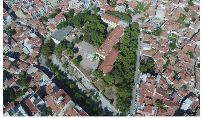
Figür 3: Hastane Höyüğü'nün hava fotoğrafı, güneybatıdan görünüm

Çalışma konusu olan Anadolu parsı heykel parçası 5 , 2015 yılında Hastane Höyüğü alanında gerçekleştirilen kazı çalışmaları sırasında ortaya çıkarılmıştır. Eserin özelliklerine değinmeden önce, buluntu yeri hakkında bilgi vermek yararlı olacaktır. Akhisar ilçe merkezi sınırları içerisindeki en önemli yükselti olarak tanımlayabileceğimiz Hastane Höyüğü alanındaki çalışmaların planlanmasında, 2013 yılı kazıları oldukça belirleyici olmuştur. Söz konusu yılda höyüğün zirve noktasında gerçekleştirilen kazı çalışmaları sırasında, anıtsal nitelikte bir yapının kalıntıları ortaya çıkarılmaya başlanmıştır. İlk kalıntılardan yola çıkılarak yapının bir sunak olabileceği düşünülmüştür 6 . Kazılar ilerledikçe kalıntıların bir sunak yapısından ziyade bir tapınak yapısına da ait olabileceği düşüncesiyle yapı "sunak/tapınak" olarak adlandırılmaya başlanmıştır 7 . Fakat son çalışmalar ışığında yapının bir tapınak olduğu sonucuna ulaşılmıştır 8 (fig. 4-6).