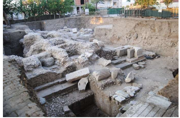
Figür 6: Tapınağın ve üzerindeki geç dönem işlik kalıntılarının güneybatıdan görünüşü

Anadolu parsı heykel parçası, tapınak alanında yürütülen kazı çalışmaları sırasında bulunmuştur. Eser, E-33/b-d plankaresi olarak adlandırılan alanda, tapınağın üzerinde yer alan geç dönem kullanımları ile bağlantılı seviye içerisinde ele geçirilmiştir. Hastane Höyüğü Geç Neolitik Çağ'dan başlayarak neredeyse günümüze kadar iskan gördüğü için tabakalar arasında bozulmalar göze çarpmaktadır. Anadolu parsı heykel parçası da bulunduğu seviye itibariyle alandaki tahribatı kanıtlaması açısından oldukça önemlidir.