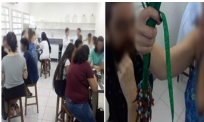
Figura 2 – Etapas de investigação. Alunos durante momento de Construção de hipóteses prévias . Destaque para Aluno e professora durante momento de Observação e manipulação