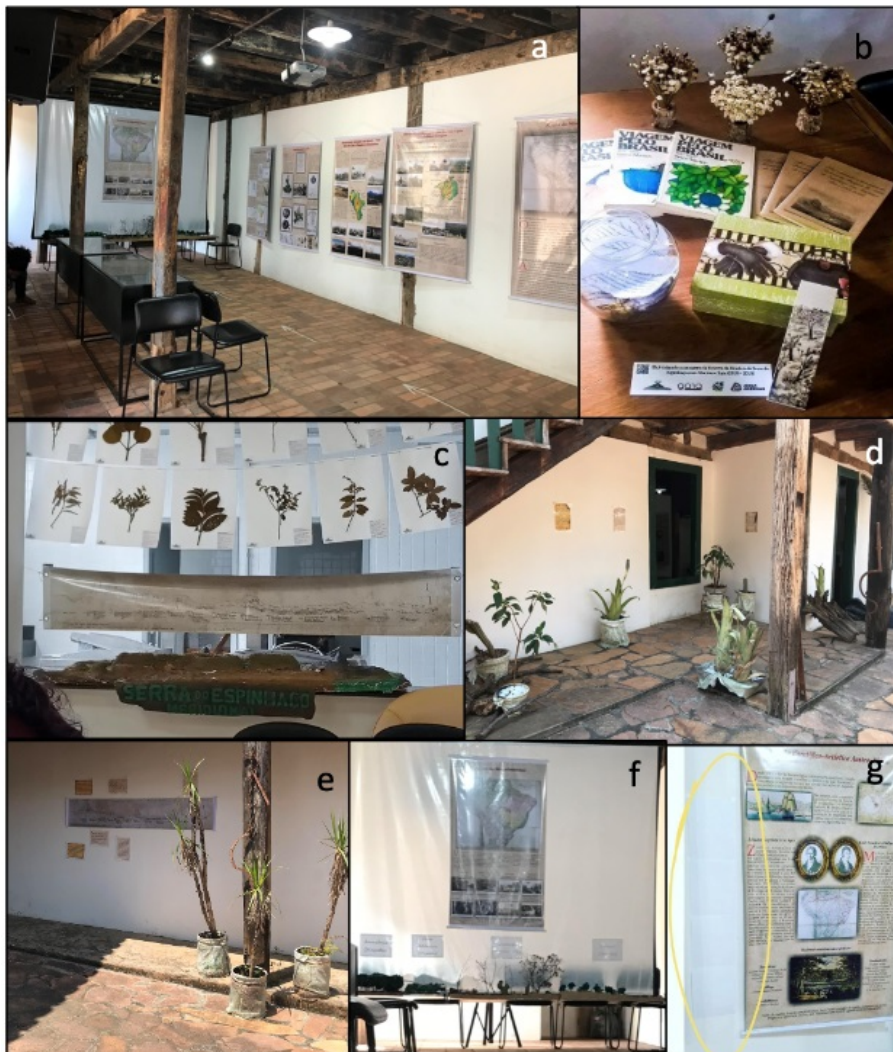
Figura 2. Fotografias de momentos de montagem da exposição cultural que contou com a) ambiente interno da exposição b) material de apoio - Viagem ao Brasil, livreto da exposição, marcadores de texto do site da exposição; c) exsicatas de espécies descritas por Martius; d, e) ambiente externo com plantas endêmicas descritas por Martius; f) maquetes dos biomas brasileiros; g) textos em Braille acompanhando textos dos banners.

por Martius durante sua passagem pela região, que compuseram o cenário da exposição (Figura 2d; Figura 2e). Maquetes de biomas brasileiros auxiliaram no entendimento dos cinco domínios florísticos propostos por Martius para o Brasil, considerado como a primeira proposta de regionalização da vegetação e que se assemelha ao atual padrão de distribuição dos biomas brasileiros (Figura 2f). Além disso, visando a maior acessibilidade ao público, cartazes em sistema Braille (Figura 2g) e em inglês com conteúdos textuais dos banners da exposição foram adicionados ao ambiente.