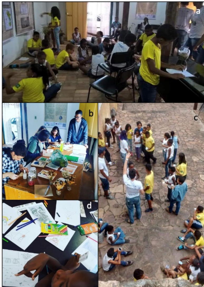
Figura 4. Momentos de práticas de Educação Ambiental. a) Momentos de reconhecimento de iconografias de Martius; b, c) Explicação sobre a confecção dos vasos com sementes de espécies do Cerrado; d) Momentos de desenhos realizados pelos visitantes