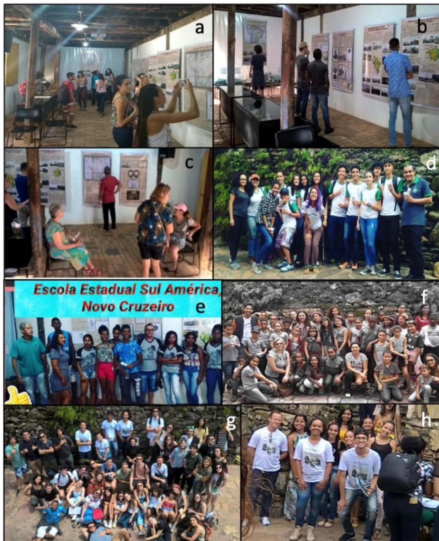
Figura 3. Momentos de visita à exposição a, b, c) moradores de Diamantina, turistas; d) estudantes do Instituto Federal do Norte de Minas Gerais; e, f) Estudantes do Ensino Fundamental e Médio de Novo Cruzeiro e Olhos D'água; g) Estudantes da UFMG; h) Monitores da exposição.