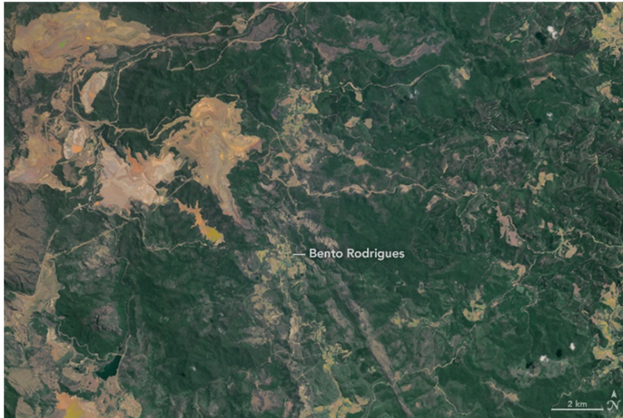
Figura A2. Imagem aérea da Mina do Fundão e Distrito de Bento Rodrigues em 11 de outubro de 2015