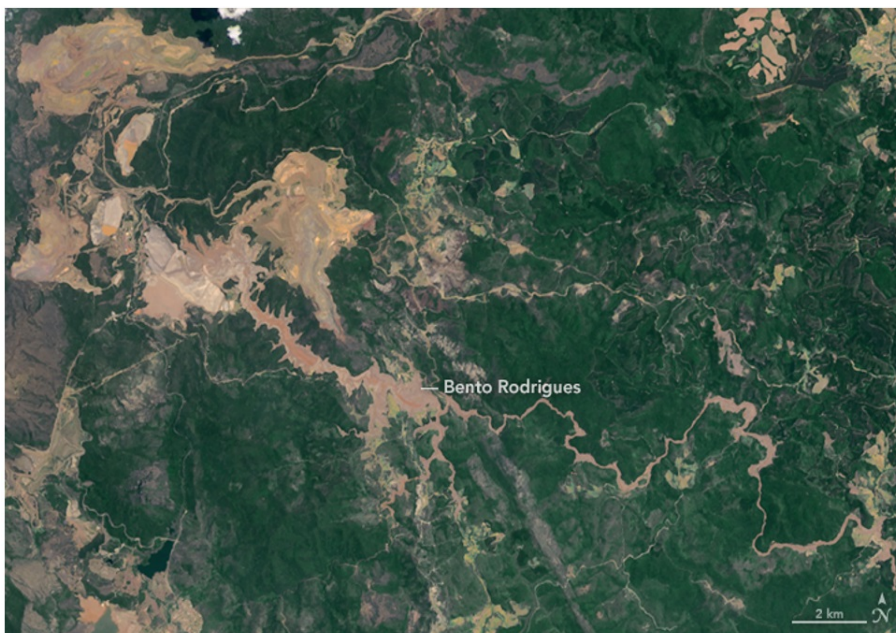
Figura A3. Imagem aérea da Mina do Fundão e Distrito de Bento Rodrigues em 12 de novembro de 2015