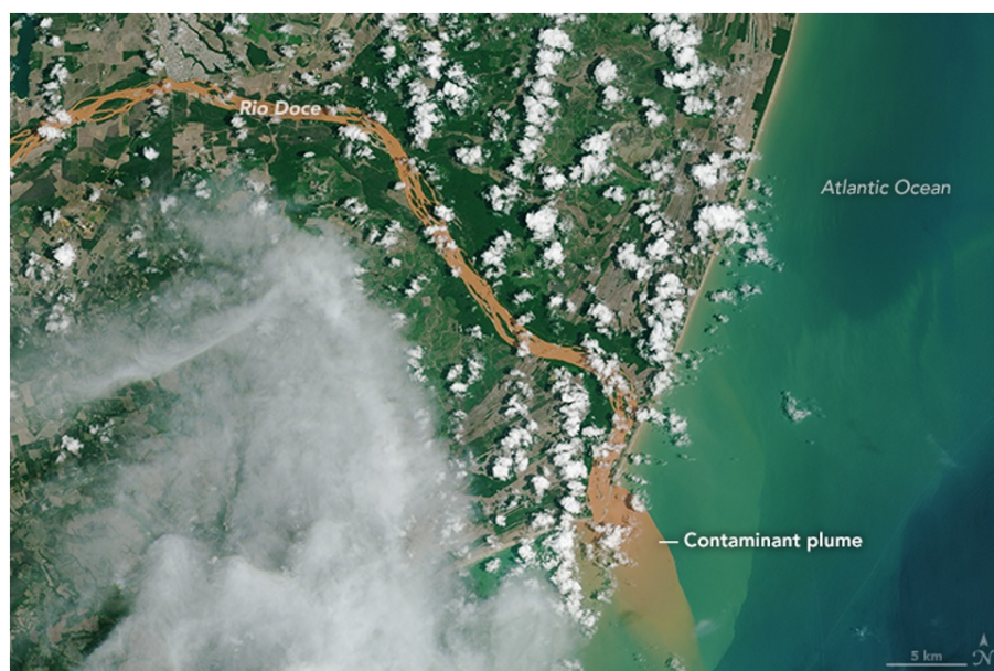
Figura A4. Imagem aérea da lama do Desastre Ambiental de Mariana no encontro do Rio Doce com o Oceano Atlântico, no Estado do Espírito Santo, 30 de novembro de 2015