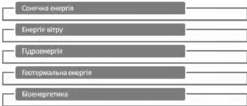
Рис. 2. Основні види відновлюваних джерел енергії *

з біомаси. Виробництво рідких видів палива з біомаси – один з ефективних способів її утилізації, що вкрай важливо для країн, залежних від імпорту первинних енергоносіїв. Це повною мірою стосується і України, забезпеченість якої власними енергоресурсами становить лише 20-25 %, а стан довілля потребує негайного покращення.