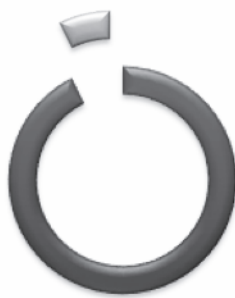
Smještaj žrtava nasilja u sigurnu kuću u 2014. godini

■ Ostale mjere zaštite ■ Smještaj u sigurnu kuću