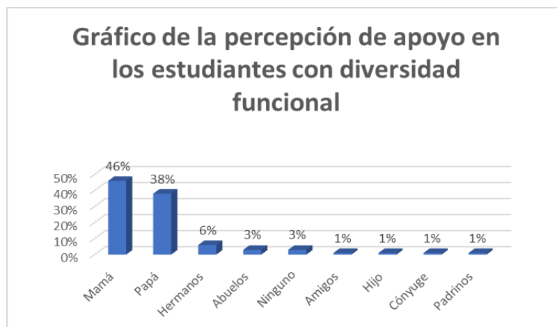
Gráfico 1. Percepción de apoyo en los estudiantes con diversidad funcional

apoyo, están: Mamá en un 47%, papá 38%, hermanos 6%, abuelos 3% ninguno 3% y entre los rangos de amigos, hijos, cónyuge y padrinos están valorados en un 1% cada uno de estos componentes, gráfico 1.