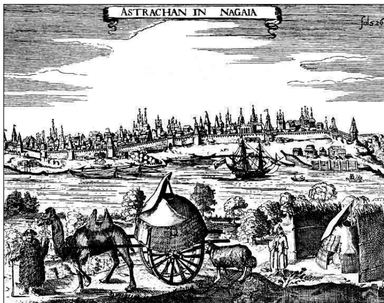
Астрахань. Гравюра из книги А. Олеария «Описание путешествия в Московию...». Середина 1630-х – первая половина 1640-х гг.

Нами рассматривалось в этой связи и сообщение голштинского путешественника и художника А. Эльшлегера-Олеария от начала XVII в., что ногайцы «делятся на несколько орд или отрядов, идут к Астрахани» [28, с. 123], поселяются в конце осени именно так, вблизи города. Действительно, для данного периода было характерно кочевание юртовцев большими группами – улусами (иногда – «ордами»), во главе с «табунными головами». Юртовцы (и едисан / джетисанцы) делились административно-территориально на 15 улусов или табунов (очевидно от монгольского – «тумен», «туман» – 10 тыс. человек, воинов).