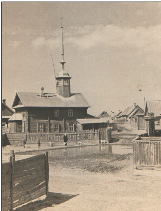
Фото мечети «Базар-аула». 1928 г.

Не вызывает споров (или принимается всеми авторами как данность), что территория Татарской Башмаковки исторически заселялась в западном направлении по реке Кизань. В итоге в большом ауле возникло четыре малых общества, обычно именуемых «махалля» – «посёлок, квартал». Они составили пять «аулов – махалля», которые удалось выявить астраханским исследователям в экспедиционной работе 80-х гг. XX в. Это были «Курнат-аул», «Кинегес-аул», «Базар-аул» и «Куж-аул» («Ходжаул»).