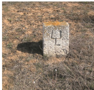
Фото тамговых знаков на плитах кладбища с. Татарская Башмаковка. 2009 г.

Photo of tamga marks on the plates of the cemetery of the Tatarskaya Bashmakovka village. 2009