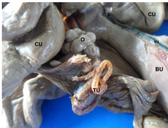
Figura 2. Útero conservado de cerda con solución fijadora conservadora chilena. TU: tuba uterina; O: ovario; CU: cuerno uterino; BU: cuerpo del útero; VU: vena uterina

Las tubas uterinas presentaron una longitud de 140,3 \pm 29,3 mm del lado derecho y 135,9 \pm 29,2 mm del lado izquierdo (figura 2). Los diferentes calibres de cada uno de los segmentos de la tuba y su pared se describen en la tabla 3.