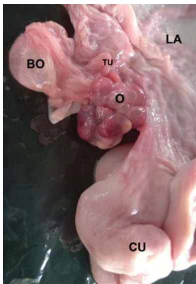
Figura 1. Útero fresco de cerda. O: ovario; BO: bolsa ovárica; TU: tuba uterina; CU: cuerno uterino; LA: ligamento ancho

calibre de 1,7 \pm 0,31 mm y una longitud de 36,2 \pm 24,1 mm; mientras que en la izquierda se observó un calibre de 1,6 \pm 0,5 mm y una longitud y 35,6 \pm 16,5 mm. La vena ovárica derecha mostró una longitud y calibre de 35 \pm 15,4 mm y 2,5 \pm 15,4 mm; la izquierda de 31,5 \pm 6,3 mm y 1,9 \pm 0,9 mm. Se observó que la vena ovárica hacía su trayecto enrollándose alrededor de la arteria ovárica.