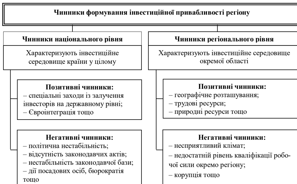
Рис. 1. Класифікація чинників формування інвестиційної привабливості регіону