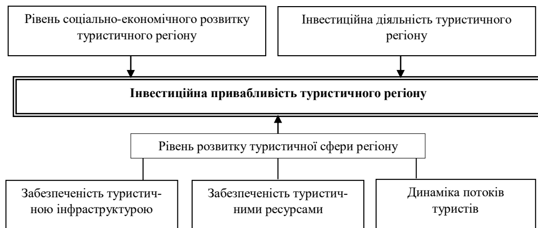
Рис. 3. Чинники впливу на інвестиційну привабливість туристичного регіону

В економічній практиці зустрічається класифікація чинників, які стримують розвиток формування позитивного інвестиційного клімату в туристичній сфері окремого регіону. Згідно з цією класифікацією, виокремлюють галузеві та зовнішні чинники [7, с. 208; 18, с. 10–11].