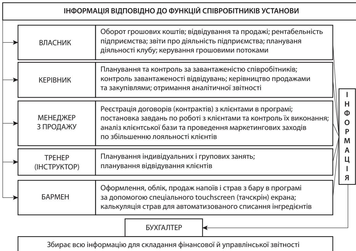
Рис. 2. Автоматизація та збір інформації для обліку та звітності фізкультурно-оздоровчих установ