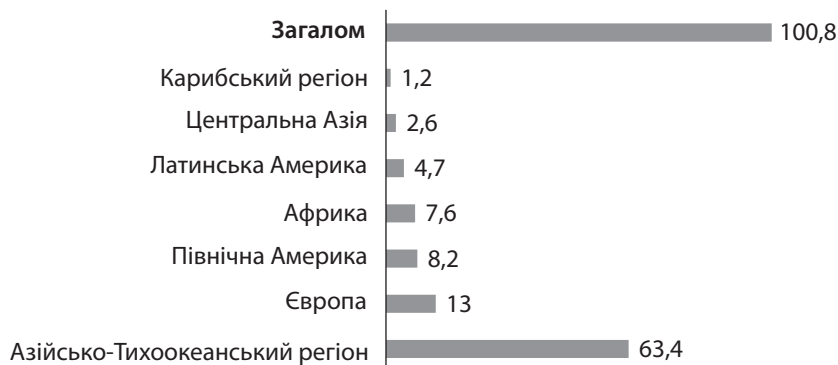
Рис. 2. COVID-19: прогноз падіння зайнятості у секторі подорожей і туризму за регіонами світу, 2020 р., млн робочих місць

Водночас експерти Всесвітньої туристичної організації підкреслюють історичну стійкість туризму