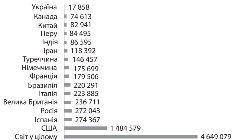
Рис. 1. Кількість випадків хворих на коронавірус (COVID-19) у всьому світі станом на 16.05.2020 р., осіб