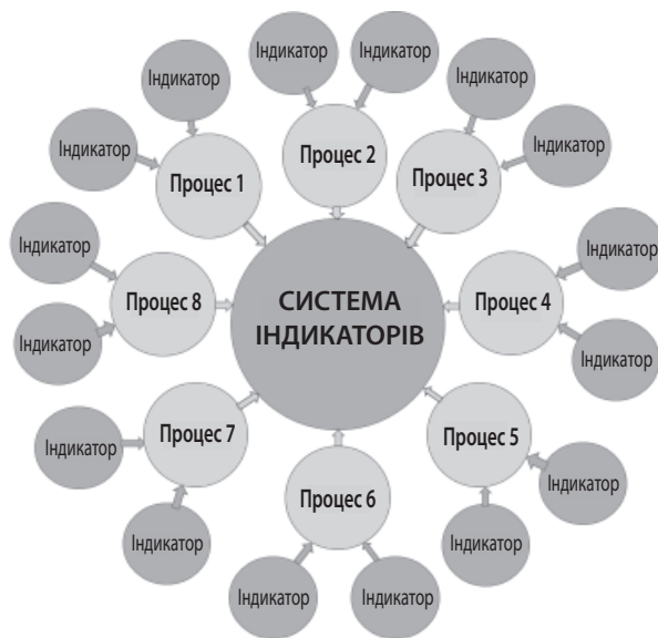
Рис. 2. Загальна система індикаторів якості процесу підготовки інформації про адміністративні правопорушення

Зобраних вище індикаторів, що належать до кожного підпроцесу, складається система індикаторів якості процесу, які, своєю чергою, формують загальну систему індикаторів якості процесів статистичного виробництва інформації про адміністративні правопорушення, що включатиме в себе понад 150 індикаторів. Приблизну структуру запланованої системи індикаторів можна побачити на рис. 2 .