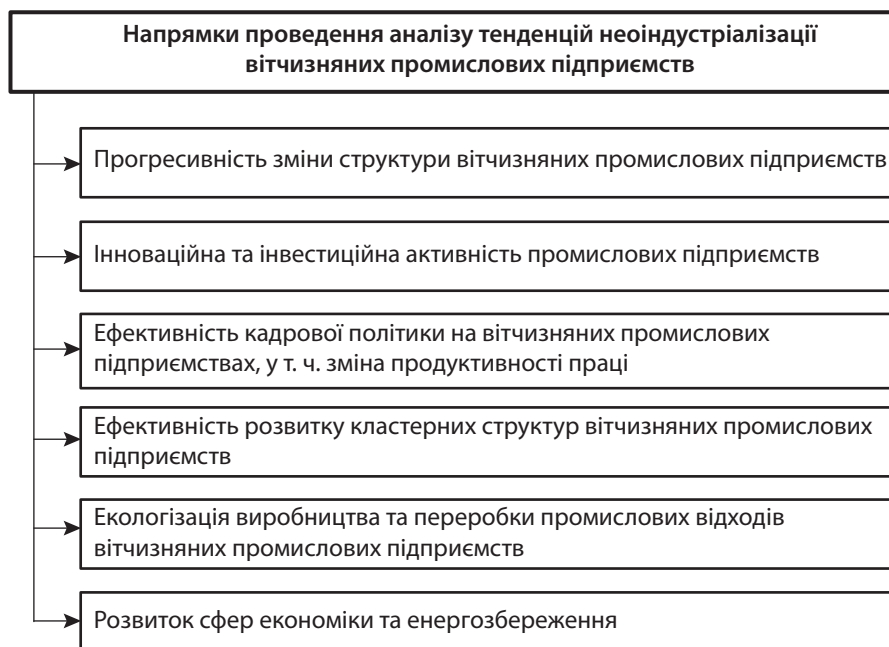
Рис. 1. Напрямки проведення аналізу тенденцій неоіндустріалізації вітчизняних промислових підприємств

Тому аналіз тенденцій неоіндустріалізації вітчизняних промислових підприємств необхідно проводити за такими напрямками, що наведені на рис. 1 .