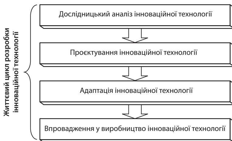
Рис. 3. Життєвий цикл розробки інноваційної технології