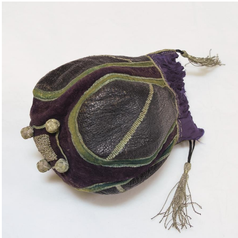
Рис. 3. Кисет. Балкарцы. РЭМ № 1256-52.

они мало относятся к делу. Надеюсь в самом непродолжительном времени получить от Вас ответ. <...> 1 .