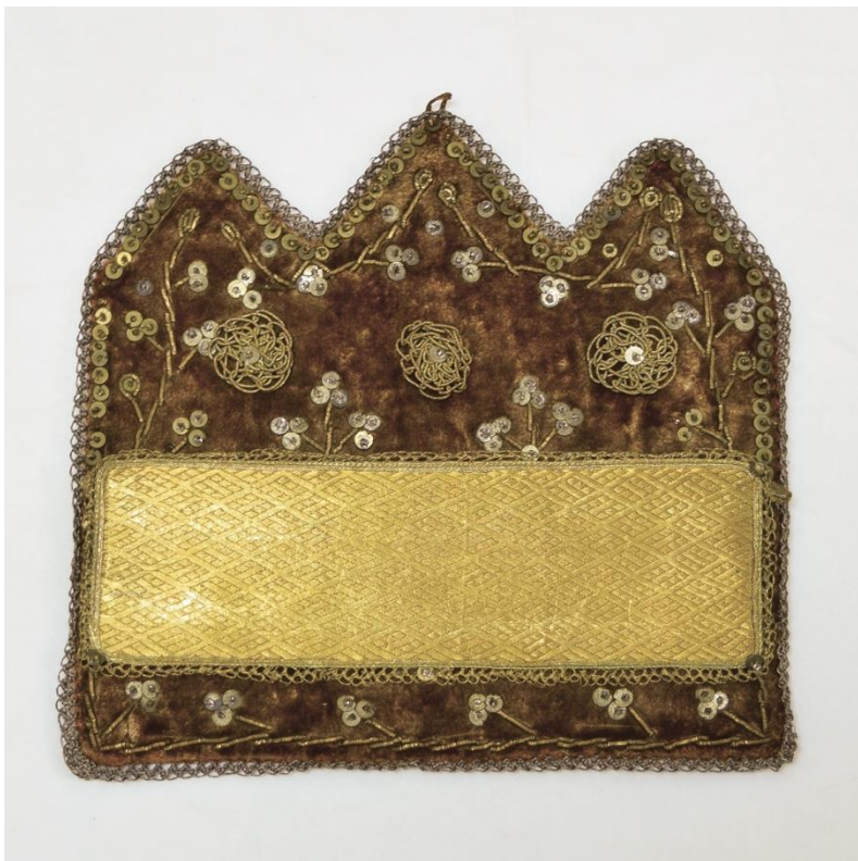
Рис. 2. Футляр для хранения писем. Балкарцы. РЭМ № 1256-49.

В горах проезд мне и перевозка вещей 1 стоили порядочно 2 , значительно больше ассигнованных 100 руб. Была как раз рабочая пара 3 . Из этого затруднения я вышел таким образом: на пополнение осетин мне было отпущено 250 руб. из них формально на накладные расходы мне выходило 85 руб. Но там все мной было заказано на месте, и если приходилось немного проезжать на плоскость, то я это делал на своих лошадях, и мне это ничего не стоило. Поэтому этой суммой я решил воспользоваться на расходы в горах. Этим я, надеюсь, нисколько не нарушил порядка собирания и распределения сумм.