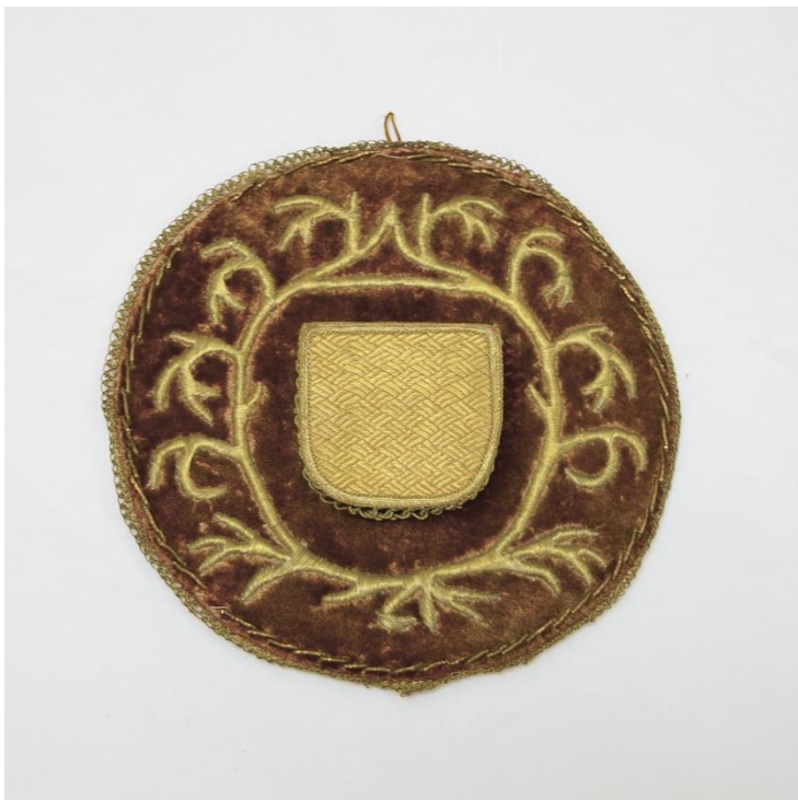
Рис. 1. Футляр для часов. Балкарцы. РЭМ № 1256-48. Фотография автора

Чтобы предметы не могли смешаться, я вел нумерацию последовательную: до 88 номера включительно предметы относятся к коллекции Горских татар, а с 89 – к коллекции кабардинцев 1 . Предметы общие обоим народностям я брал однажды, например костюм, оружие и т.д. Кроме того я по возможности не приобретал вещей, вошедших в осетинскую коллекцию: напр[имер] плут, люлька с принадлежностями и прочее. За исключением ткацкого станка. Его я приобрел во время тканья сукна и купил полностью со всеми принадлежностями и наполовину сотканным 2 сукном. Заплачено за это 30 руб. и при приобретении его имел в виду манекен женщину-кабардинку, сидящую за станком.