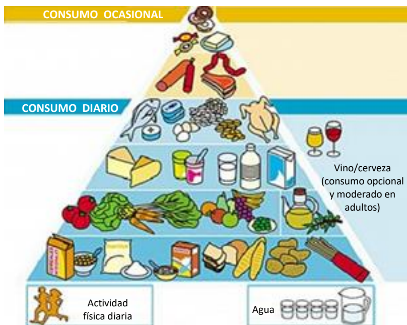
Figura 1. Pirámide Alimentaria. Fuente:(7)

Existe gran variedad de información sobre como alimentarnos bien, entre ellas la pirámide alimenticia. La pirámide alimenticia es una herramienta didáctica sobre los tipos de alimentos a ingerir, la frecuencia de su consumo y la cantidad necesaria para garantizar las necesidades nutricionales de su organismo (Figura 1).