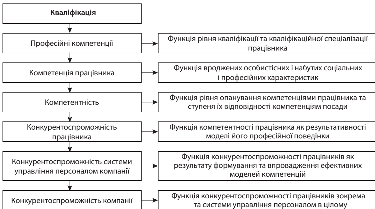
Рис. 2. Ієрархія понять предметної царини дослідження «управління персоналом компанії на основі компетентнісного підходу»