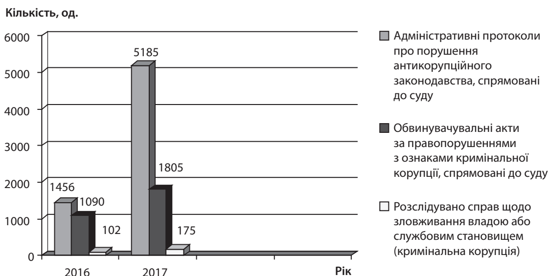
Рис. 2. Кількість спрямованих до суду і розслідуваних справ у сфері економічних злочинів в Україні протягом 2016–2017 рр.

Виходячи з наведених на рис. 2 даними бачимо, що у 2017 р. порівняно з 2016 р. у 3,56 разу більше спрямовано до суду адміністративних протоколів про порушення антикорупційного законодавства; у 1,66 разу більше – обвинувачувальних актів за правопорушеннями з ознаками кримінальної корупції.