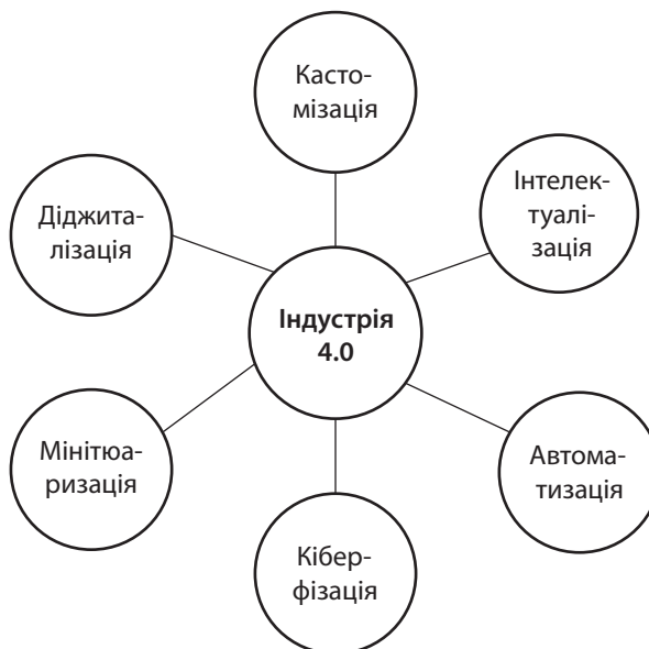
Рис. 2. Принципи концепції «Індустрія 4.0»