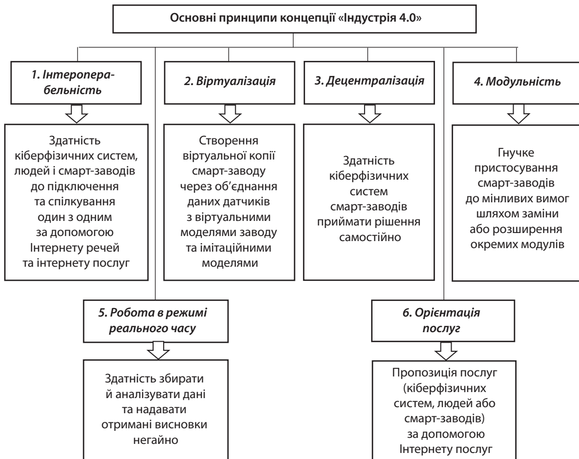
Рис. 1. Основні принципи концепції «Індустрія 4.0»