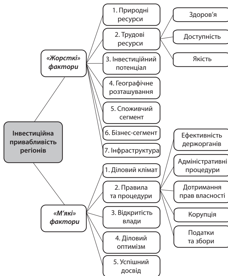
Рис. 2. Фактори впливу на інвестиційну привабливість