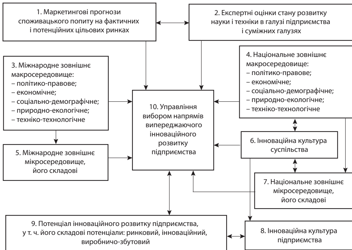
Рис. 1. Схема управління вибором напрямів випереджаючого інноваційного розвитку підприємства