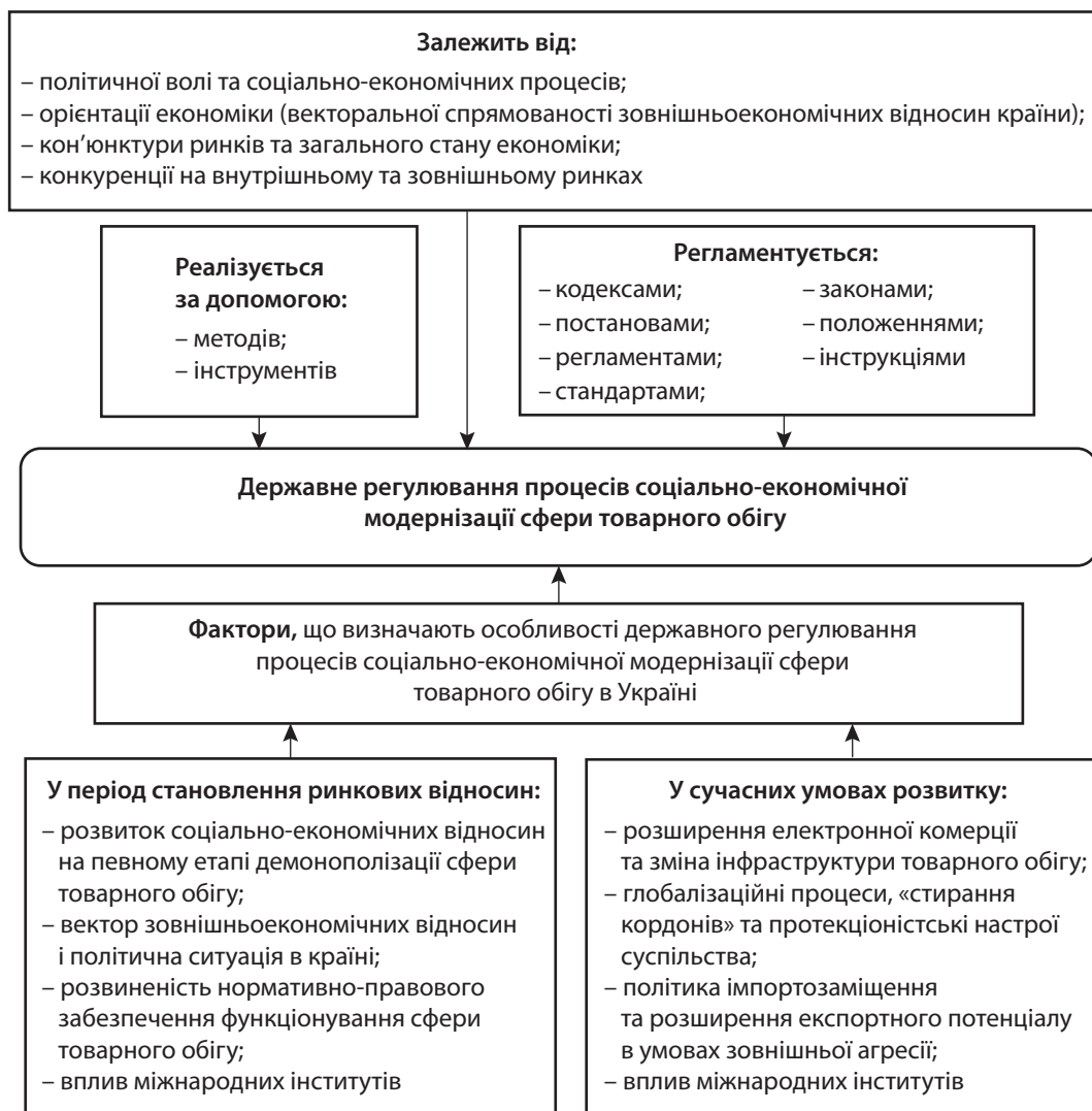
Рис. 1. Загальне бачення реалізації процесів державного регулювання соціально-економічної модернізації сфери товарного обігу

Кон'юнктура ринків та загальний стан економіки країни обумовлюють структуру попиту та пропозиції на ринках, на що відповідним чином реагують суб'єкти сфери товарного обігу. Змінюється рівень конкуренції, виникає потреба в отриманні конкурентних переваг, аналізується провідний світовий досвід і формуються передумови модернізаційних процесів. Держава за допомогою відповідних методів та інструментів реалізує заходи з регулювання процесів модернізації відповідно до стратегічного ба-