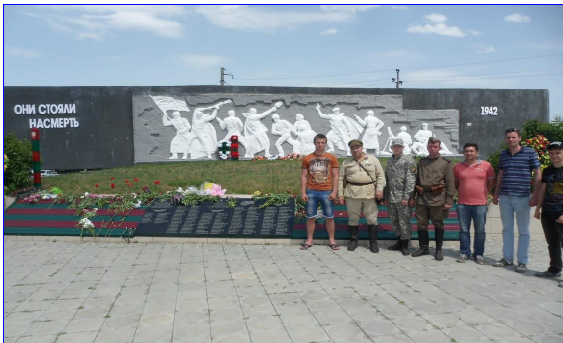
Рис. 1. Мемориал воинам 24-го погранполка. Поселок Маныч-строй, западнее г. Пролетарск

За боевые подвиги и массовый героизм личного состава 24-й Прутский пограничный полк был награжден орденом Красного Знамени. Отдавая дань уважения мужеству пограничников, жители Сальского района Ростовской области насыпали на месте боя курган — Курган бессмертия. На его вершине воздвигнут обелиск Славы, на котором высечено: «Вечно будет жить в памяти сальчан подвиг пограничников 24-го полка!».