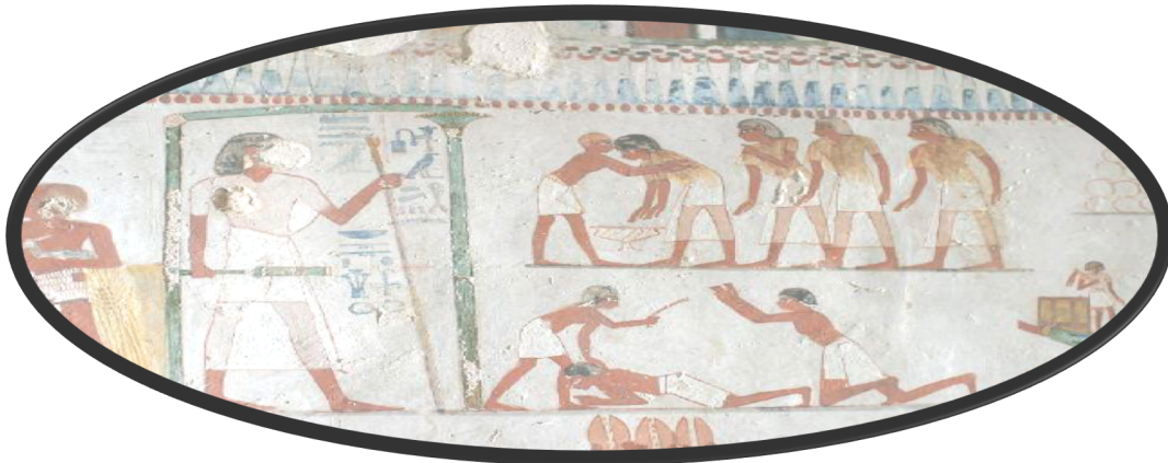
Resim 1 Eski Mısır'da Vergi (M.Ö. 3.000)

Bu günkü anlamından ve içeriğinden kısmen farklı olarak Vergiler, insan toplulukları ile birlikte uygarlığın ilk devirlerinde gönüllülük esası ile ortaya çıkmışlardır. Vergilerin ilk devirlerde kendisinin öncülü olarak topluluk halinde yaşamının kaçınılmaz gereklerinden sayılarak gönüllük esası ile ortak yaşam ve yönetim ihtiyaçlarının karşılanması amacıyla parasal ödemelerden ziyade takas devirlerinin doğasına da uygun olarak hediye, bağış biçimindeki aynı katkılarla ortaya çıkmaya başladığı bilinmektedir (Kayan, 2000, s. 80-87). Vergisel kamu ödemeleri tarih boyunca geçirilen değişim süreci ile birlikte yaklaşık bu günkü anlamına yakın olarak M.Ö. 4.000