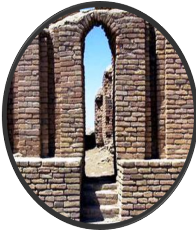
Resim 2; "bit kârim" Eski Babil'de Vergi ve Hazine Dairesi (M.Ö. 2.500)

İlk dönemlerdeki bu gönüllülük, sınırsız insan ihtiyaçları ve nispeten daralan doğal kaynaklar karşısında yaşanan savaşlar ve neticesinde köleleştirme ve mülk edineme hukukunun ortaya çıkmaya başlaması ile yerini zorunluluğa terk etmeye başlamıştır.