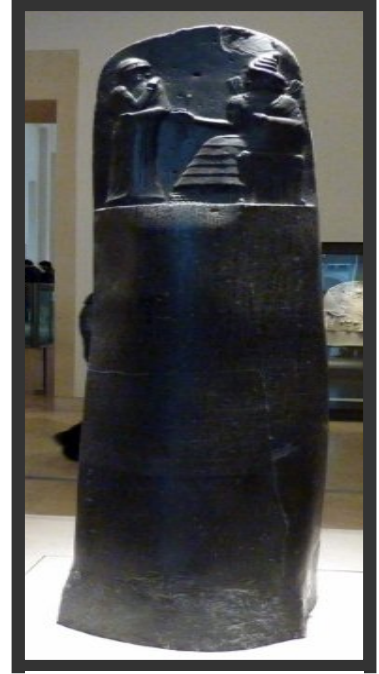
Resim 4: Hammuarbi yasalarında, bir asker, balıkçı ve bir vergi mükellefinin tarlası bahçesi veya evi satılamaz, satılsa dahi Tableti (Sözleşmesi) kırılır. Tımarının bir kısmı karısına veya kızına devredilemez veya rehin verilemez (M.Ö. 1790).

• Balık Vergisi(mas-da-ria): Balıkların pazarlama sırasında uygulanan vergidir. Bu balıklar büyük (300 balık kapasiteli) ve küçük sepetlerde pazarlama işlemi gerçekleştirirdi.