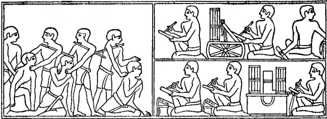
Resim 3 İlkçağlarda Vergi Ödemeyenlerin Cezalandırılması

Eski çağlarda krallar tarafından konulan ağır vergiler sık sık halkın tepki göstermesine yol açmıştır. Bunun sonucunda devlet karşıtı güçler ile ağır vergi yüklerine karşı çıkan halk kitleleri birleşerek birçok devrimin tarihe geçmesini sağlamışlardır. Örneğin, Sümer kent devleti M.Ö. 2.415-2.400 dolaylarında Lagas'ı yöneten Urukagina Kralı'nın Urukagina Reformları veya Urukagina Yasaları adıyla bilinen metine göre; Tanrı Ningursu, Legaş krallığını Urukagina'ya vermiştir. Urukagina 36.000 adam arasından kral olarak seçilince eski yasaları yeniden uygulamaya koymuştur. Borçlarını ve vergilerini ödeyemeyen Lagas oğulları için ilk vergi affını çıkarmıştır. Pamuk üzerinden alınan vergiler ile mabetlerdeki mükelleflerden alınan vergileri kaldırmış.