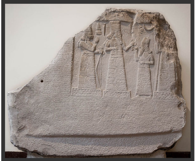
Şekil 1 İsin'li Lipit İstar vergi oranında 1/5'den 1/10'a ilk indirim (M.Ö 1870).

İlk artan oranlı gelir vergisinin 2.600 yıl önce Yunanistan'da uygulandığı bilinmektedir. Bu uygulamalar vatandaş ve servetler üzerinden alınan vergilerde oranların çok yükselmesine yol açmıştır.