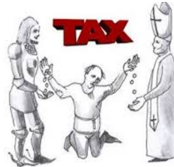
Resim 6 Orta Çağda "İspanyol Vergi Politikaları"

Roma imparatorluğunun çöküşüyle birlikte kurulmuş olan mali sistemleri de işlevini yitirmeye başlamış veya Osmanlılar gibi yerini alan diğer egemenlikler, beylikler, krallıklar tarafından ülkenin ekonomik durumuna göre değiştirilerek aynı veya benzer adlarla ve oranlarla uygulanmaya devam edilmiştir. Arazi sahipleri ile dönemlerin egemenleri veya iktidarları arasında yüzyıllarca süren çatışmalar doğmuştur. Protestanlığın reformuna kadar geçen süreçte kiliselerin yetkileri de giderek artmıştır. Hatta kiliseler devletten daha fazla gelirlere sahip olmuş (Tax, 2009, s. 1). Devletin giderleri arttıkça devlet veya sarayın ihtiyaçlarının karşılanmasında ganimet savaşlarının yanı sıra sadece halktan alınan vergiler kaynak olarak kullanılmıştır. Din adamları ise, kamusal ve eğitim hizmetleriyle uğraşmaları nedeniyle vergiden muaf tutulmuşlardır. Buna göre 13. yüzyılda hibe şeklinde olan ve sürekli alınmayan vergiler 14. yüzyılda süreklilik kazanmıştır (Project, 2004, s. 16).