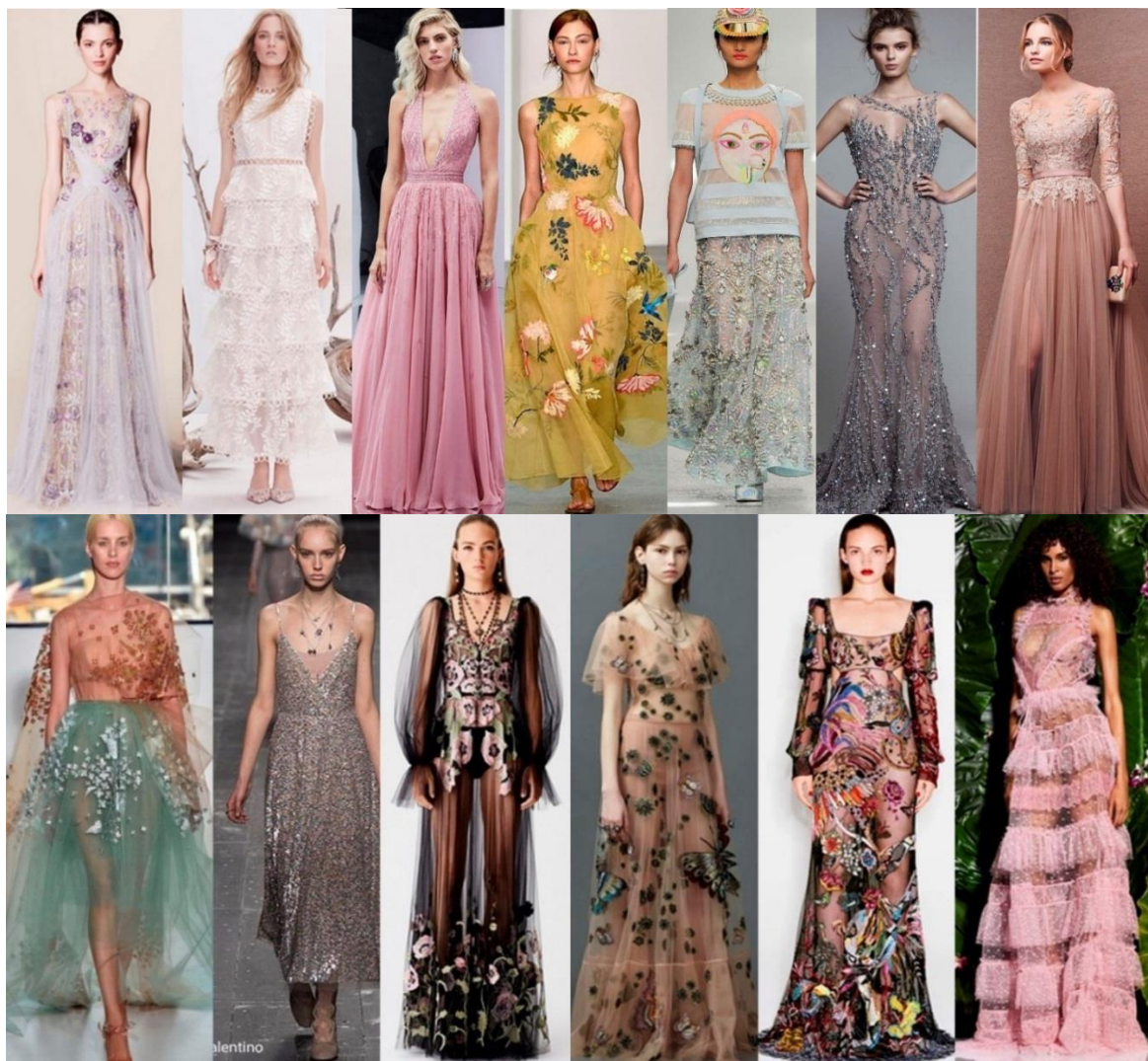
Рисунок 5. Вечерняя мода ( https://goo.gl/t6eEHb )

Особая женственность и изящество воплотились в новом сезоне в вечерней моде: платья в пол, из тончайшего шелка, шифона и органзы, усеянные немислимым количеством бисера, страз, бусин, расшитые различными рисунками, напоминающие волшебные, сказочные иллюстрации к детским книжкам. Благородная ткань, изящный декор, в данном модном сегменте дизайнеры соблюдают умеренность, естественность цветового решения, подчеркивая природную красоту женского силуэта. Воздушные, свободные силуэты, летящие, тончайшие ткани не оставят равнодушными ни женщин, ни мужчин (Рисунок 5).