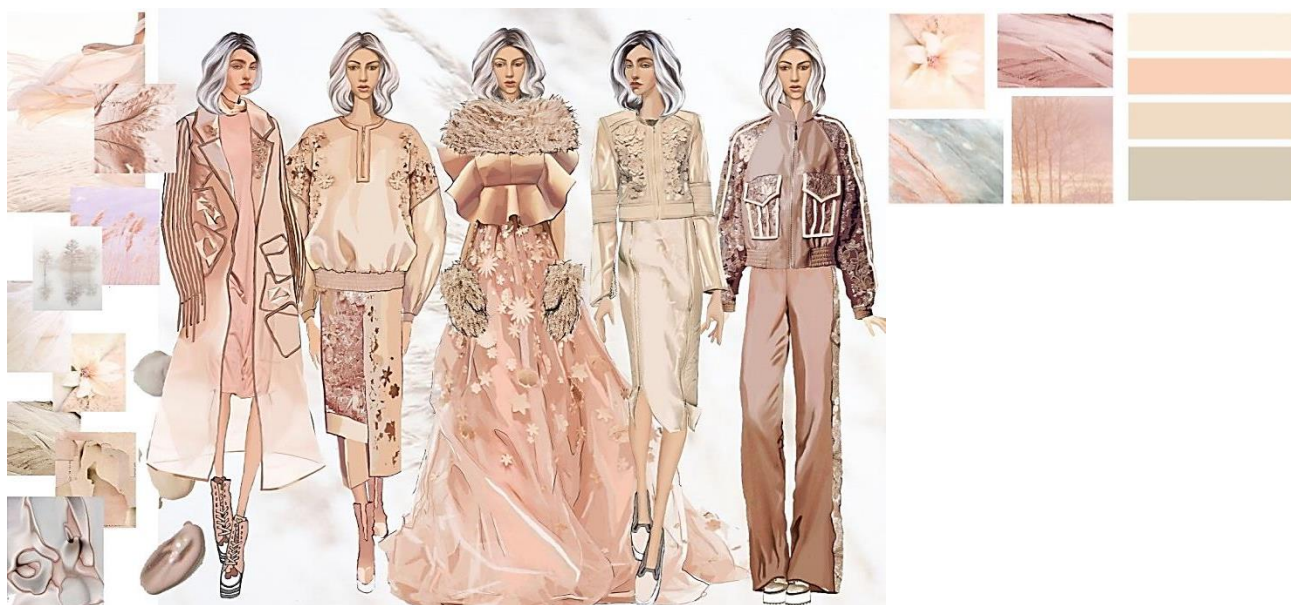
Рисунок 13. Цветовая карта и структура коллекции.

Разработанная коллекция одежды предназначена для современной и творческой девушки, чья жизнь наполнена множеством ярких эмоций, знакомств, впечатляющих событиями, интересными мероприятиями. Женственная, легкая, изящная, сдержанная, но в то же время ультрасовременная девушка, уверенная в себе. Модели одежды сочетают в себе несколько стилистических решений, что позволяет их комбинировать как между собой, так и с другими вещами из гардероба, и использовать их, как и в повседневном костюме, так и в качестве вечернего варианта. В коллекции присутствуют модели одежды различных силуэтных решений и разных ассортиментных групп: пальто, куртка, свитшот, бомпер, платье, юбки, брюки. Модели можно комбинировать как между собой, так и с другими вещами из гардероба.