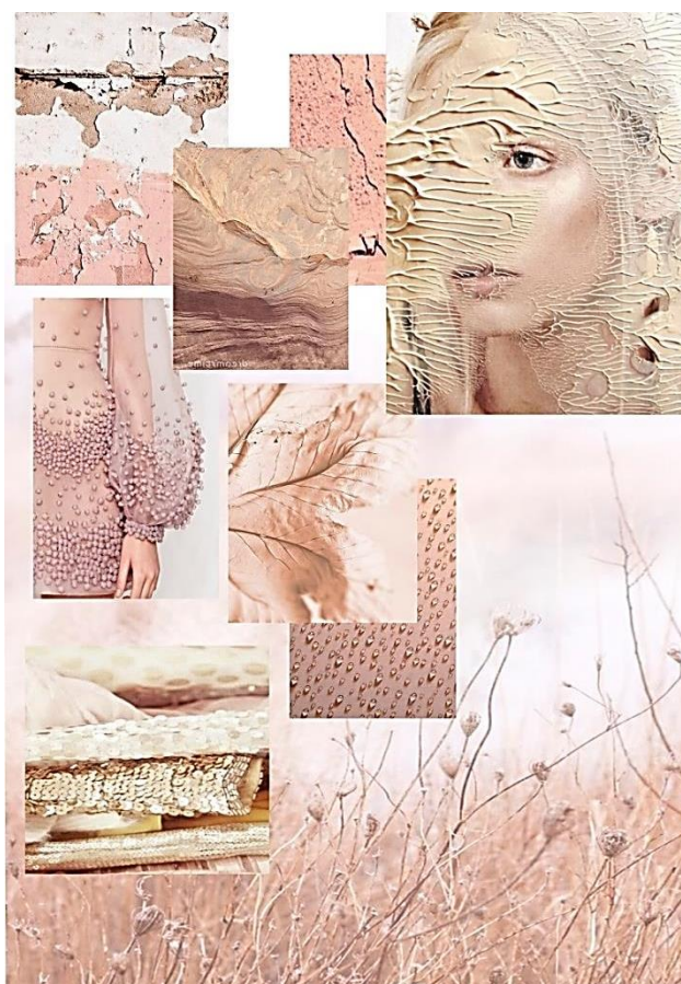
Рисунок 11. Графический анализ источника вдохновения.

Припудренные пылью цветы, на которых еще блестят капельки утренней росы, зыбкий, но в то же время легкий туман, естественные, плавные и текучие линии, сложные формы, все эти проявления природы, послужили вдохновением для создания моей коллекции одежды. Ни что так не украшает женщину, как естественность, натуральность, легкость, загадочность и это всегда вне моды, так как женщина часть самой природы, ее гармоничное и идейное составляющие.