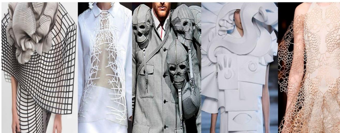
Рисунок 10. Дизайн с использованием современных технологий ( https://goo.gl/t6eEHb ).