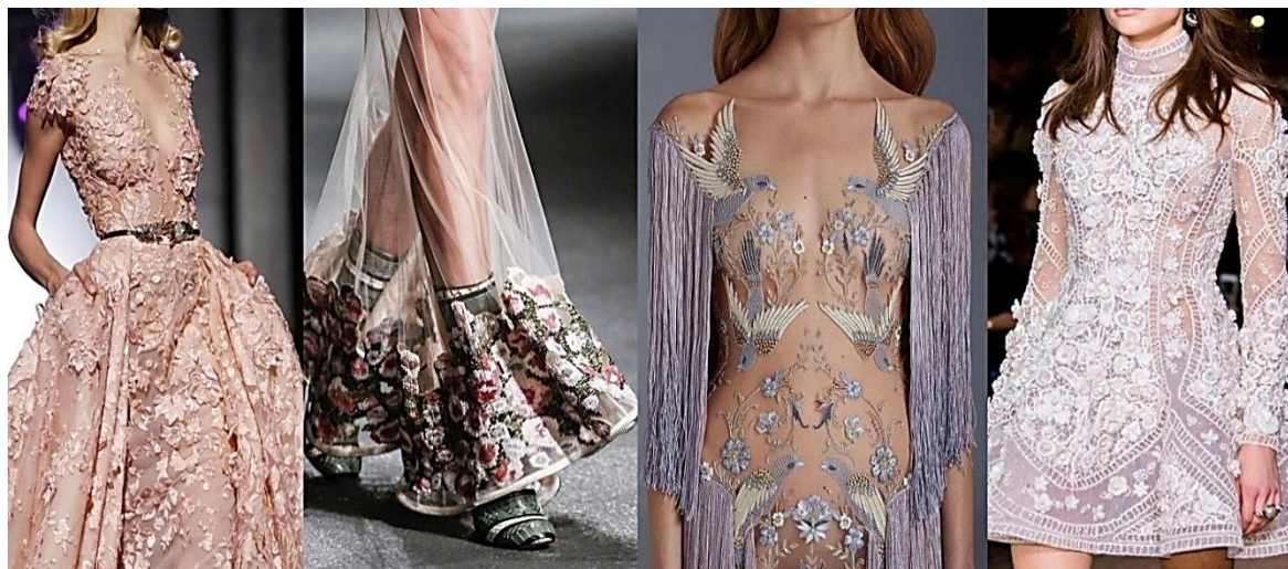
Рисунок 6. Декорирование в вечерних нарядах ( https://goo.gl/t6eEHb ).

длины сочетается не только с романтичными блузками и топами, но и с яркими объемными свитерами «оверсайз», свитшотами, бомперами (Рисунок 7).