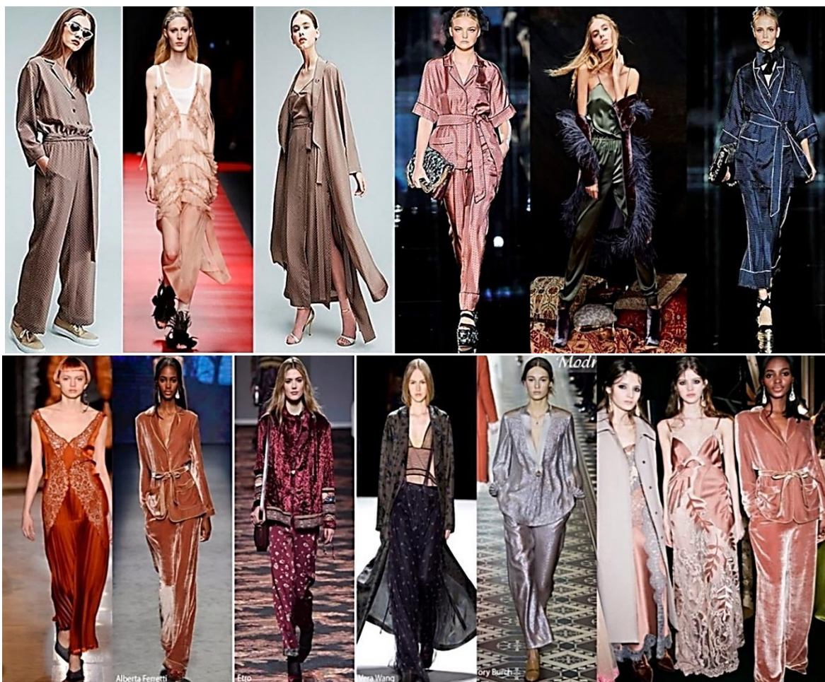
Рисунок 3. Модные цвета в коллекциях этого сезона ( https://goo.gl/t6eEHb ).

ассортименте одежды, используя их в элегантных кашемировых пальто, вечерних и повседневных платьях.