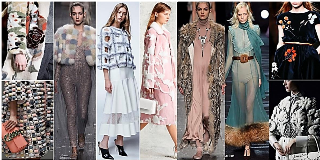
Рисунок 8. Использование меха в декоре ( https://goo.gl/t6eEHb ).

флористические узоры, выпуклый рисунок, урбанистические пейзажи, визуальные иллюзии, объемные и замысловатые фигуры. Следовательно, мы можем сделать вывод о том что технологический прогресс безусловно влияет на моду и вдохновляет авангардный дизайнеров (Рисунок 10).