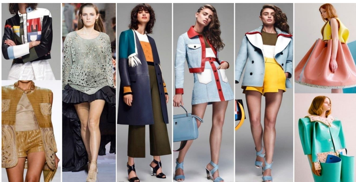
Рисунок 4. Использование нескольких цветов ( https://goo.gl/t6eEHb ).

Эти оттенки смотрятся аристократично, женственно, благородно и выглядят как никогда свежо. Некоторые модные дома предлагают использовать два — три пастельных оттенка, сочетая их в рамках одного образа (Рисунок 4).