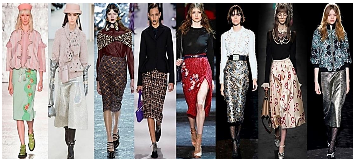
Рисунок 7. Сочетание разных стилей в одном образе ( https://goo.gl/t6eEHb ).

Мех: искусственный, натуральный, различных фактур, стриженный, крашенных, он охватил весь ассортимент одежды. Используется в качестве декора или как основной материал. Дизайнеры, последние несколько сезонов не остаются равнодушными к этому материалу, изобретая новые технологии его обработки и методы соединения (Рисунок 8).