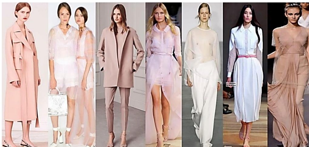
Рисунок 12. Анализ моделей аналогов.

Для нахождения и обособления собственного авторского решения коллекции было проведено аналитическое исследование по образному сходству моделей одежды, с целью поиска и изучения моделей-аналогов, дабы избежать возможности повторения, и сосредоточится на новых аспектах. Исследование различных источников информации: модных журналов, каталогов, снимков, опубликованных в печатных изданиях, сайтов и модных интернет блогов, фотографии моделей одежды, разработанных другими дизайнерами в разных временной отрезок, помогло обнаружить и изучить аналогичные изделия [3–8].