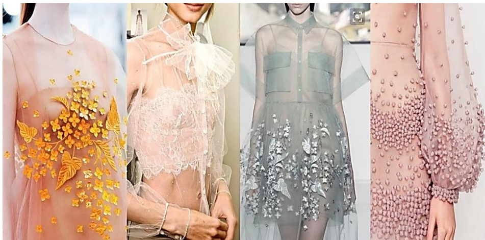
Рисунок 1. Использование прозрачности ( https://goo.gl/t6eEhb ).

Изучив последние коллекции одежды передовых дизайнерских брендов на модной арене, было выявлено несколько перспективных модных тенденции, многие из них благодаря новой трактовке современных дизайнеров приобрели второе дыхание. Один из трендов — это прозрачность, чувственная и экстремальная, безумно изящная и нежная (Рисунок 1).