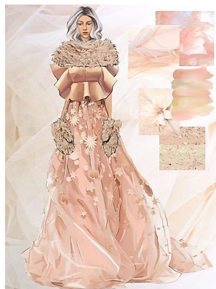
Рисунок 14. Творческие эскизы.