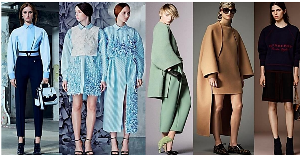
Рисунок 9. Размер «оверсайз» с закругленными плечами ( https://goo.gl/t6eEHb ).