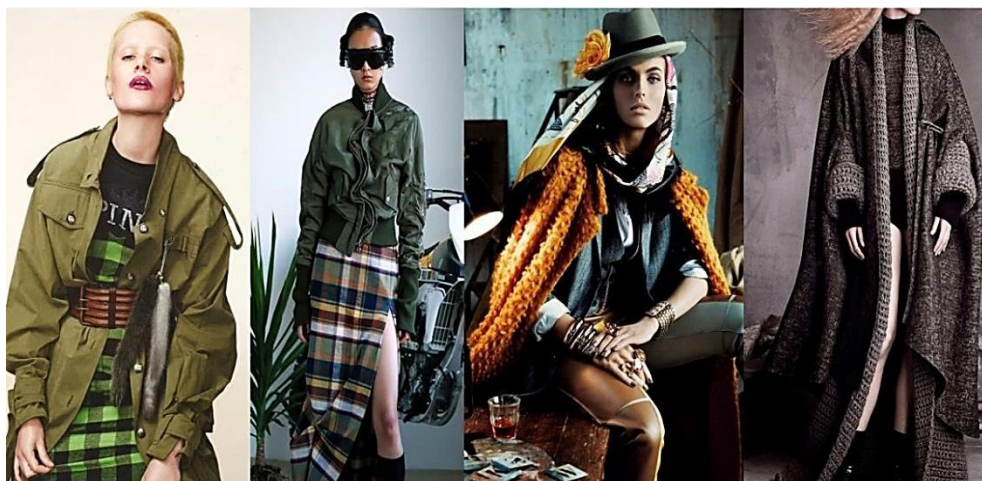
Рисунок 2. Примеры многослойности ( https://goo.gl/t6eEHb ).

Чем абсурдней кажется сочетание вещей вместе, тем актуальней, интересней и как ни странно гармоничней они будут смотреться на их обладательнице, таковы веяния последних модных тенденции. Что раньше смотрелось безвкусно и вызывающе, в новом сезоне на пике популярности. Смелость, экстравагантность, вызов, ирония и гиперболизация образа — ответ общества на данную тенденцию. Так же встречается и обманчивая многослойность в рамках одного изделия, сочетание различных фактур и тканей, (например использования техники пэчворк) не говоря уже о стилевом единстве деталей.