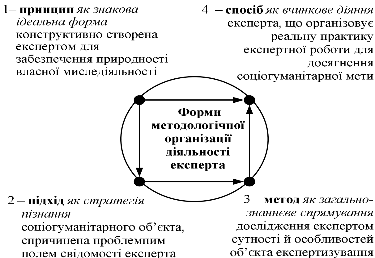
Рис. 2. Базові форми методологїчної організації експертної дїяльності

Важливою базовою формою методологїчної організації дїяльності експерта є спосїб, який за умови його належного усвїдомлення та рефлексування слугує знаряддям, засобом чи їнструментом мислення, дїяльності, мислєдїяльності і професїйного мислення [14, с. 22; 15], тобто є практико акцентованою, реконструйованою формою їснування методу. Спосїб для експерта – це певна вчинкова дїя, система прийомів, що уможливлєє здїйснення комплексної гуманїтарної експертизи і при цьому організовує практику так, що завжди приводить до досягнення реальної мети.