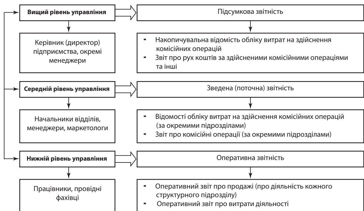
Рис. 2. Накопичення та групування інформації у звітності та її використання за рівнями управління на підприємствах, які здійснюють комісійні операції