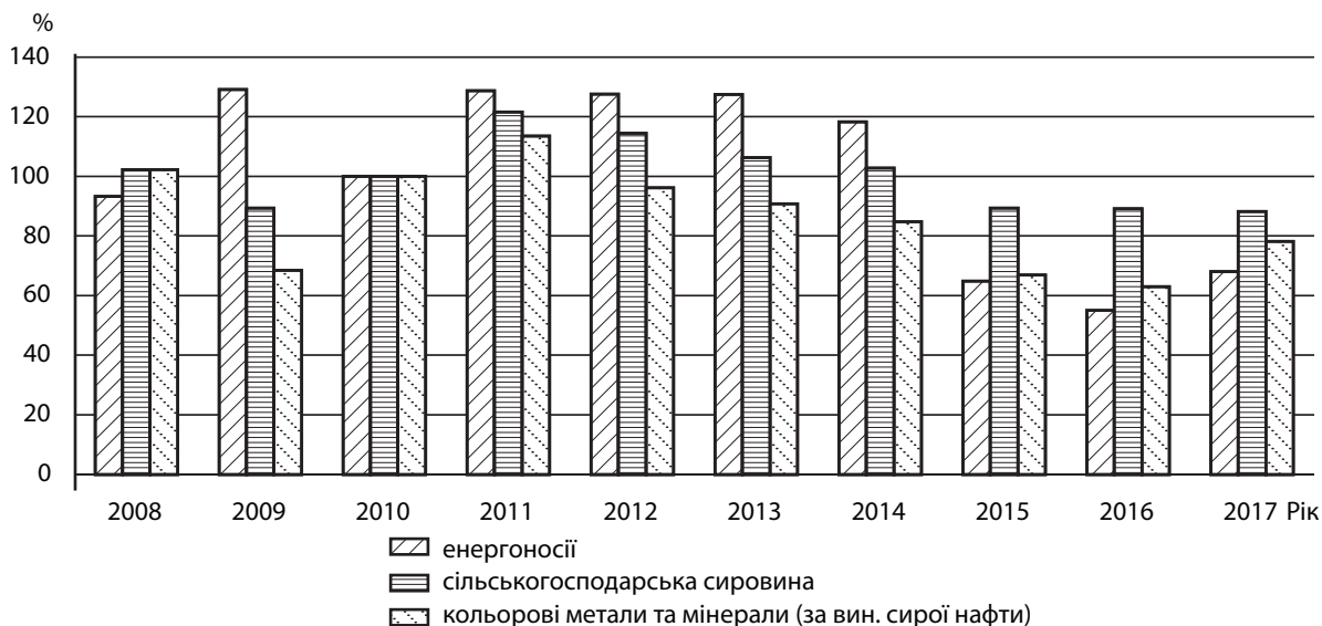
Рис. 2. Динаміка світових цін на сировинні товари у 2008–2017 рр. (2010 р.=100)