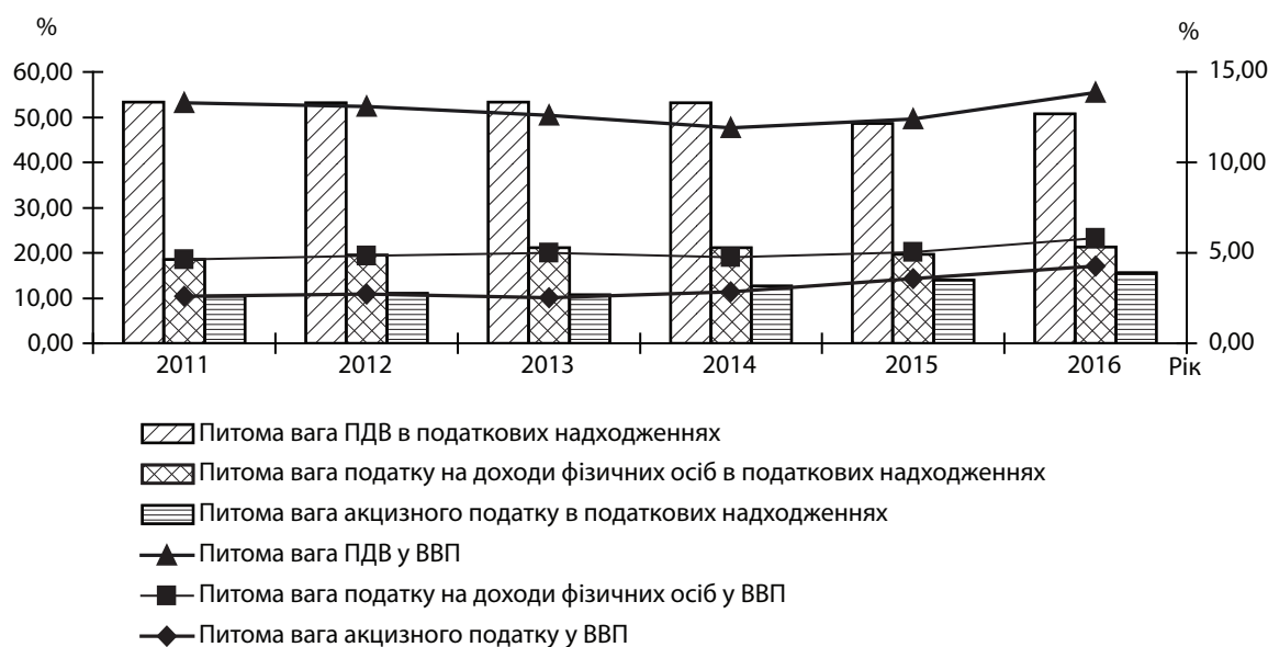
Рис. 3. Фіскальна ефективність податкових надходжень (ПДВ, податок на доходи фізичних осіб, акцизний податок)

Аналіз фіскальної ефективності інших податкових надходжень, який наведено на рис. 3, дозволяє зробити такі висновки: найбільшу частку у структурі податкових надходжень мають внутрішні податки на товари та послуги – це ПДВ та акцизний податок, загальний обсяг надходжень від ПДВ у 2016 р. склав 329,911 млрд грн (50,69%), що на 83,053 млрд грн більше ніж у 2015 р., загальний обсяг надходжень від акцизного податку також збільшився в 2016 р. і склав 101,751 млрд грн, що на 44% більше ніж у попередньому році; спостерігається позитивна тенденція збільшення надходжень від адміністрування податку на доходи фізичних осіб, їх обсяг мав приріст у 38,8% порівняно з минулим роком і становив 138,782 млрд грн.