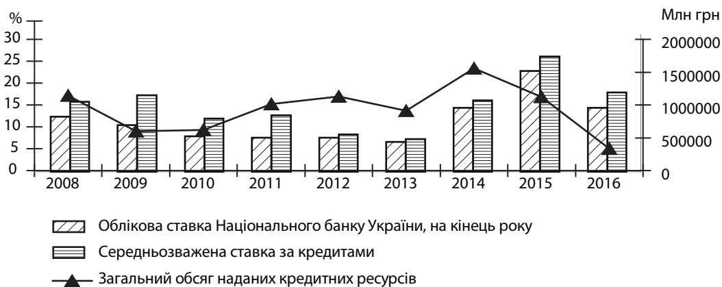
Рис. 2. Динаміка зміни облікової ставки НБУ й обсягу наданих кредитів банками

В ажливим фінансово-кредитним важелем прямого впливу є регулювання облікової ставки. Облікова ставка (або ставка рефінансування) є одним з інструментів грошово-кредитної політики центрального банку, який призначений, перш за все, для регулювання вартості кредитних ресурсів. Динаміку зміни облікової ставки НБУ, середньозваженої ставки по кредитах та обсягу наданих кредитів наведено на рис. 2.