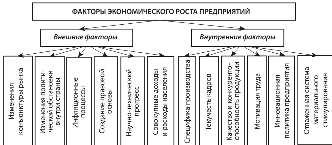
Рис. 2. Систематизация факторов экономического роста

Следует различать понятия «экономический рост» и «развитие». Развитие определяется как необратимое качественное изменение объектов любой природы, движение которых приводит не только к количественным изменениям, но и порождает новые качества. Причиной развития являются внутренние противоречия объекта. Понятие развития в общем виде определяется как изменения процесса или явления от более простого к более сложному и более эффективно. Таким образом, экономическое развитие – это процесс количественных и качественных характеристик экономической системы при ее переходе из одного состояния в другое.