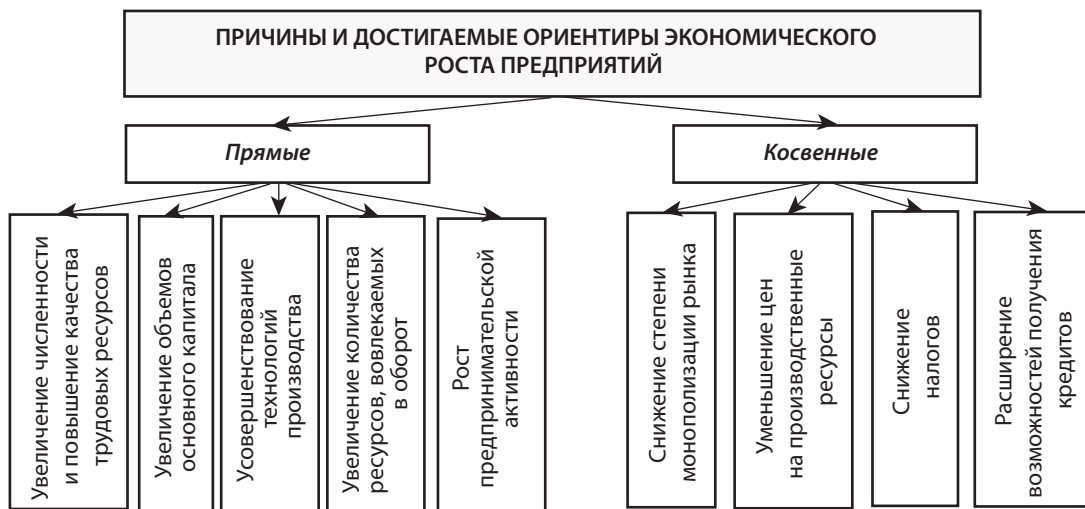
Рис. 3. Классификация причин и ориентиров экономического роста