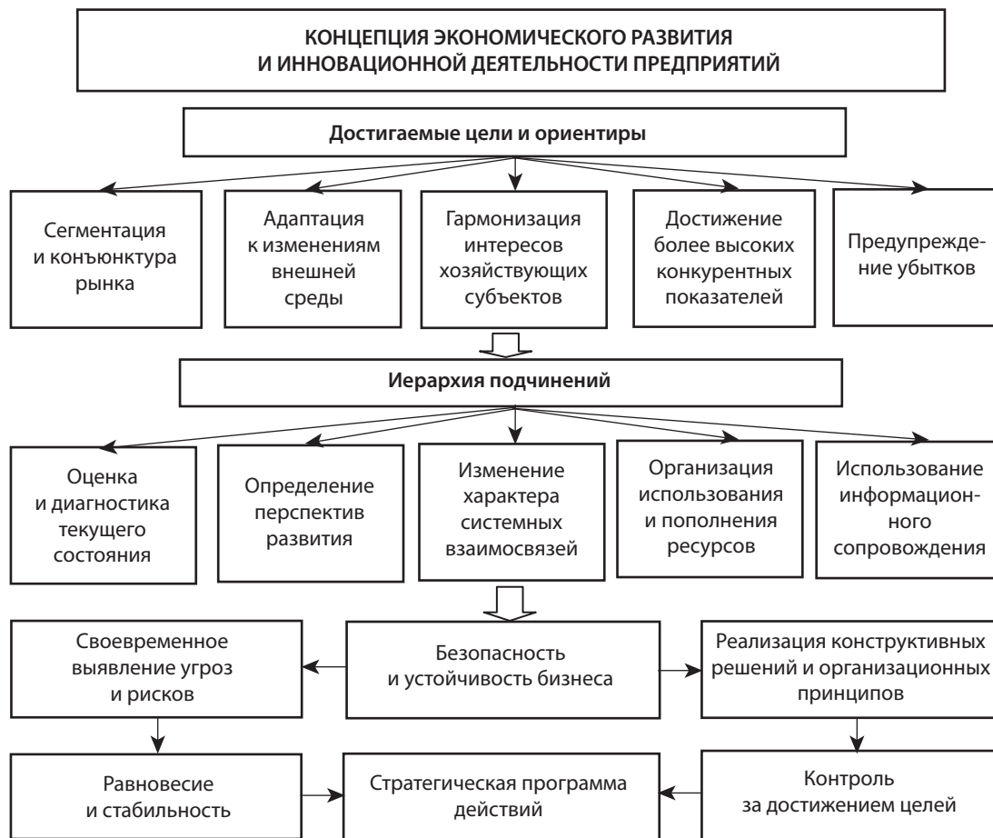
Рис. 4. Концепция экономического развития и инновационной деятельности предприятий

В предлагаемой концепции экономического развития предприятий в условиях динамических изменений внешней среды существенно уменьшается роль материально-ресурсных компонентов производства и повышается роль интеллектуальной составляющей управления за счет использования ситуационного подхода, который позволяет среди множества данных выделить те, которые непосредственно влияют на результирующую величину за счет установления