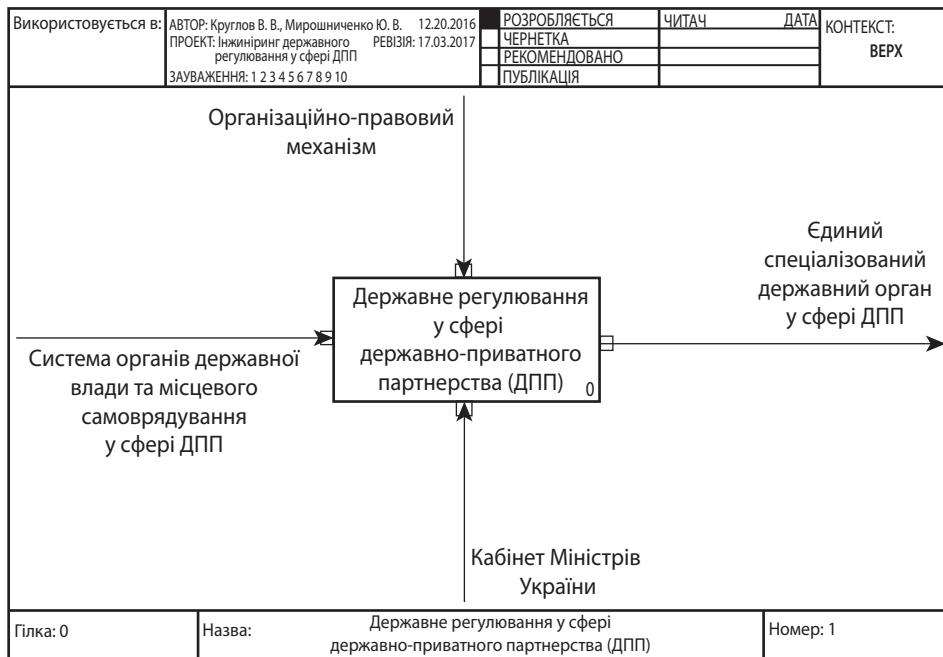
Рис. 1. Контексна діаграма моделі державно-управлінського процесу «Державне регулювання у сфері державно-приватного партнерства»

На наступному етапі проводиться декомпозиція державно-управлінського процесу «Державне регулювання у сфері державно-приватного партнерства» на процеси 1 рівня (рис. 2):