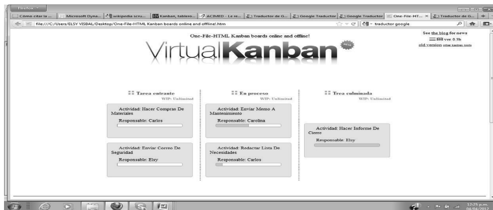
Gráfico N° 3. Ejemplo de Kanban virtual.

Un ejemplo de Kanban virtual es el que expone en el Gráfico N° 3, donde se pueden agregar columnas, tareas y porcentajes de proyectos en ejecución de manera muy sencilla.